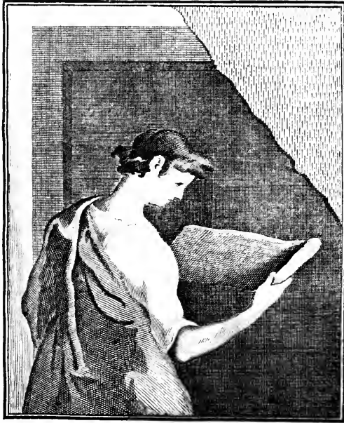
THE J. PAUL GETTY MUSEUM LIBRARY