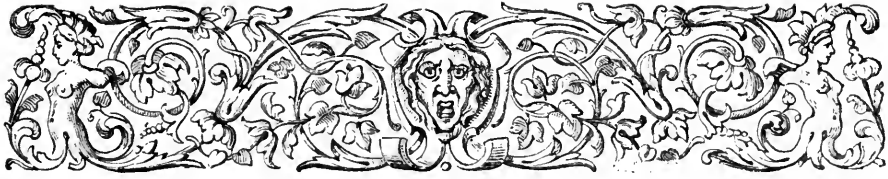
TABLE DES DIVISIONS