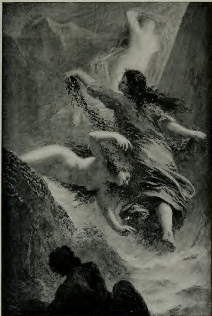
Scène Première de l'Or du Rhin .