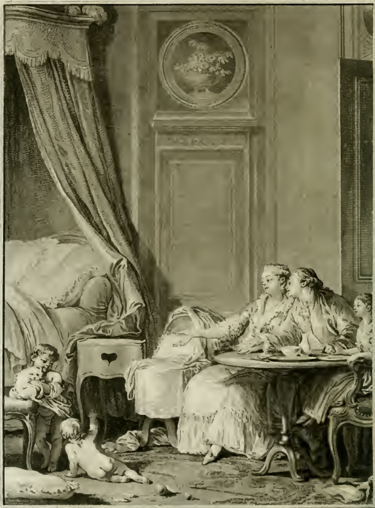
M. Moreau del.