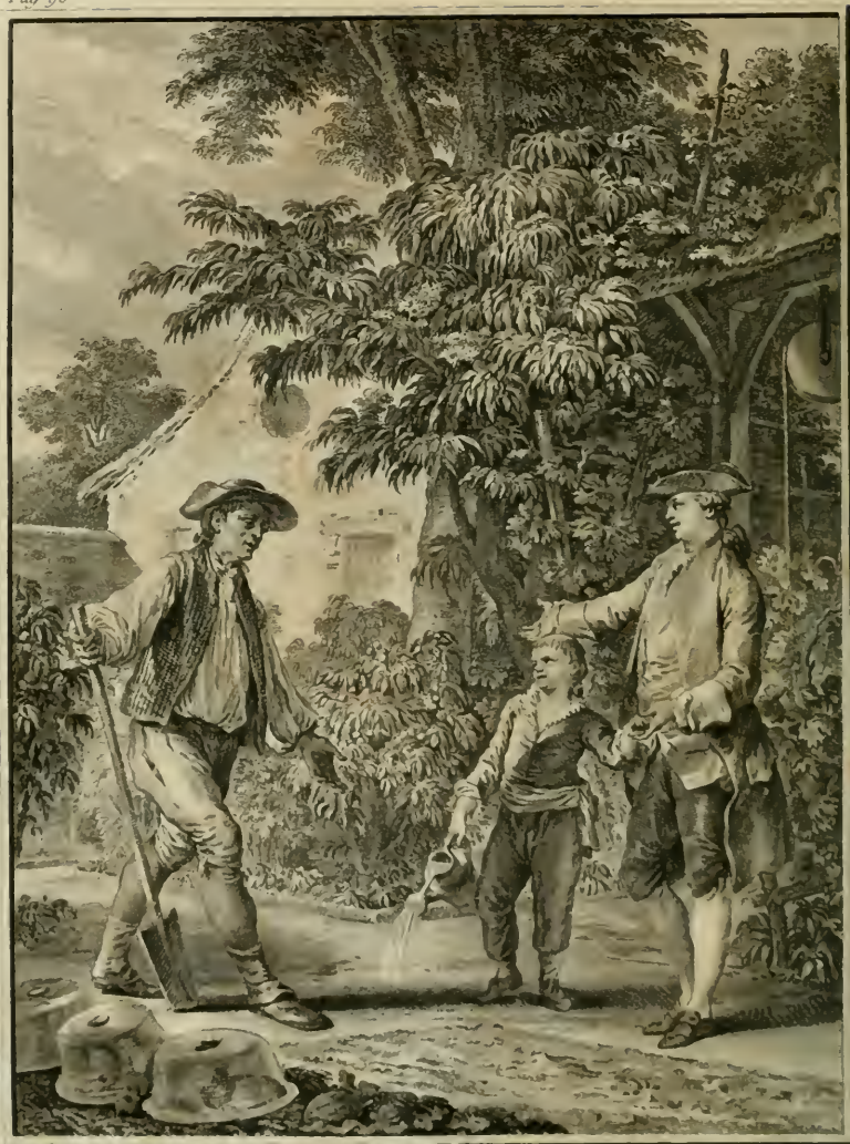
Chacun respecte le travail des autres, afin que le sien soit en sûreté.