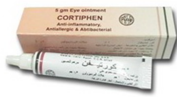
جاري اضافة صورة حلينة