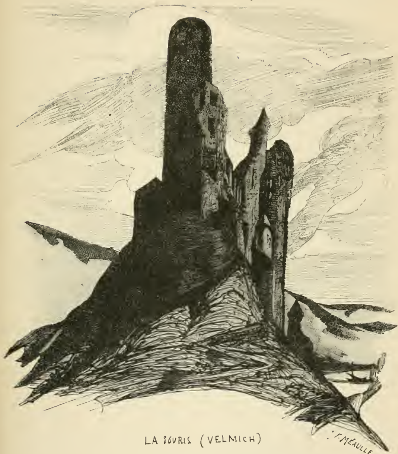
LA SOURIS (VELMICH) SEPT. 1840. - POUR MON CHARLOT