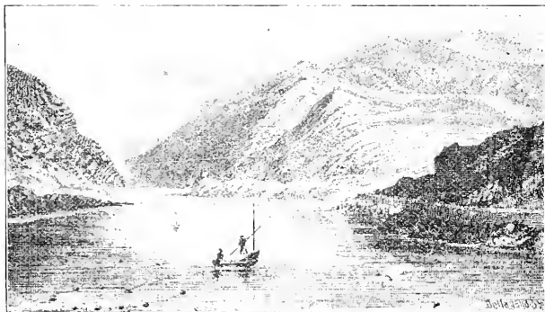
Y WYDDFA O LLANBERIS.

Daew Gwm Glas, y fan y bu yr “hen Gatrin,” o hynod gofia oblegid ei nherth awraidd, yn byw hamer caurif a nawy yn ol. Ysgytiai hon unrhyw un i angau a feiddiai sanga ar ei hawliau fel brehinus y lle. Yno yn swm brefiadau y defaid y treuliodd oes faith, a llawn o wrhydri. Mor dlws ydyw y llanerebau bychain gleision sydd o gwmpas y fangre; ie, y maent oll yn y llyn,—a daew bent y gromlech hefyd, a'r afon fechan drystiog yng ngwaelod y Pass, yn cwyni yn grychias yn ei hyndrech i lifo i lawr rhwng y meini mawrion, i gytraedd