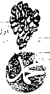
الورقة الأولى من المخطوطة الثانية من كتاب شرح العقيدة الوسطى

تتمت هذه المخطوطة في شهر ربيع الثاني سنة ثمان مائة وثمانين سنة من الهجرة النبوية تتمت هذه المخطوطة في شهر ربيع الثاني سنة ثمان مائة وثمانين سنة من الهجرة النبوية تتمت هذه المخطوطة في شهر ربيع الثاني سنة ثمان مائة وثمانين سنة من الهجرة النبوية تتمت هذه المخطوطة في شهر ربيع الثاني سنة ثمان مائة وثمانين سنة من الهجرة النبوية تتمت هذه المخطوطة في شهر ربيع الثاني سنة ثمان مائة وثمانين سنة من الهجرة النبوية تتمت هذه المخطوطة في شهر ربيع الثاني سنة ثمان مائة وثمانين سنة من الهجرة النبوية تتمت هذه المخطوطة في شهر ربيع الثاني سنة ثمان مائة وثمانين سنة من الهجرة النبوية تتمت هذه المخطوطة في شهر ربيع الثاني سنة ثمان مائة وثمانين سنة من الهجرة النبوية