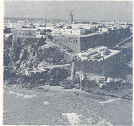
قصة الأودية بمدينة الرباط ، ويجدو بجانبها مصب نهر ابو رقراق

« دعوة الحق » - قسم التوزيع - وزارة عموم الاوقاف - الرباط تليفون 308.10 - 327.03 - الرباط