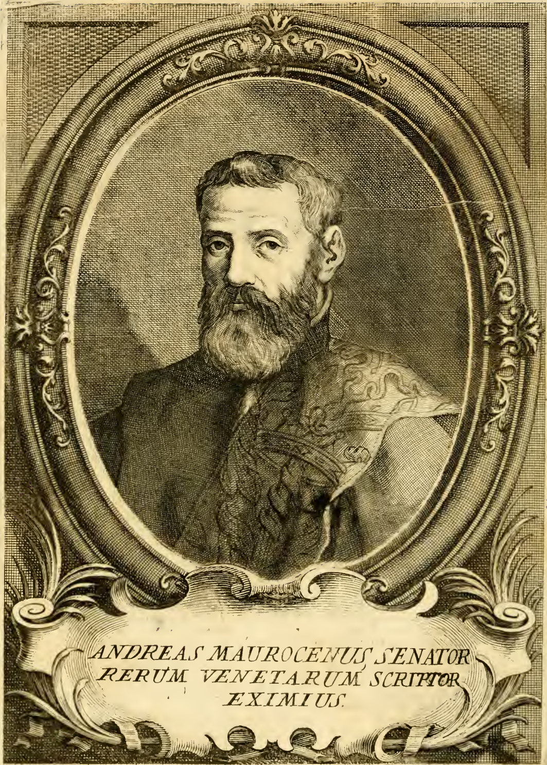
ANDREAS MAUROCENUS SENATOR RERUM VENETARUM SCRIPTOR EXIMIUS.