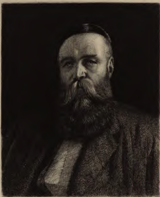
Leop. Fleming sculp.