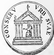
Figura pro foribus sedens Roma creditur ab antiquariis: at cur non et Imperatoris ipsius, pari habitu sedentis, simulacrum dici possit? Patarol.

Signum dedit ] Sequor Dei , nam mox subjicit, ‘debetur et divinitati tuæ simulacrum aureum,’ &c. Livin. Simulacrum Constantini aureum, radiato forsitan capite, quod Deorum fuit. Plinius Panegy. cap. LII. ‘Horum unum si præstitisset aliis, illi jamdudum radiatum caput, et media inter Deos sedes anro staret, aut ebore.’ Cellar. An nomen Dei , ut ‘Divinum’ appellaverit ante mortem? An signi nomine templum intelligit, quod Constantino sacrum cernimus in postica nummi Constantiniani parte, quem exhibeo: