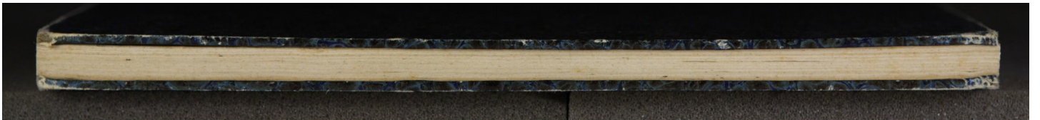
Early European Books, Copyright © 2009 ProQuest LLC. Images reproduced by courtesy of the Royal Library, Copenhagen. 4° Fys. 14825