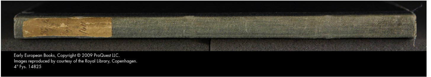
4° Fys. 14825