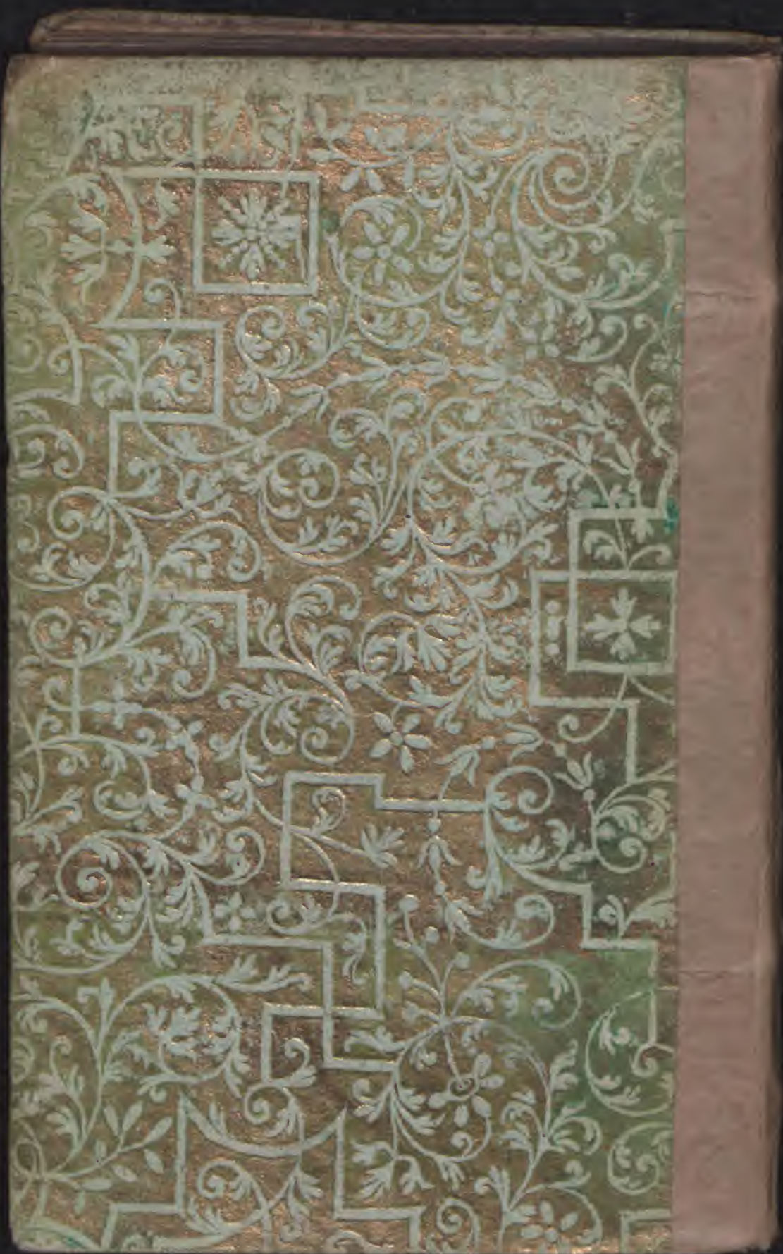
Hielmst. 2730 8° (LN 1664)