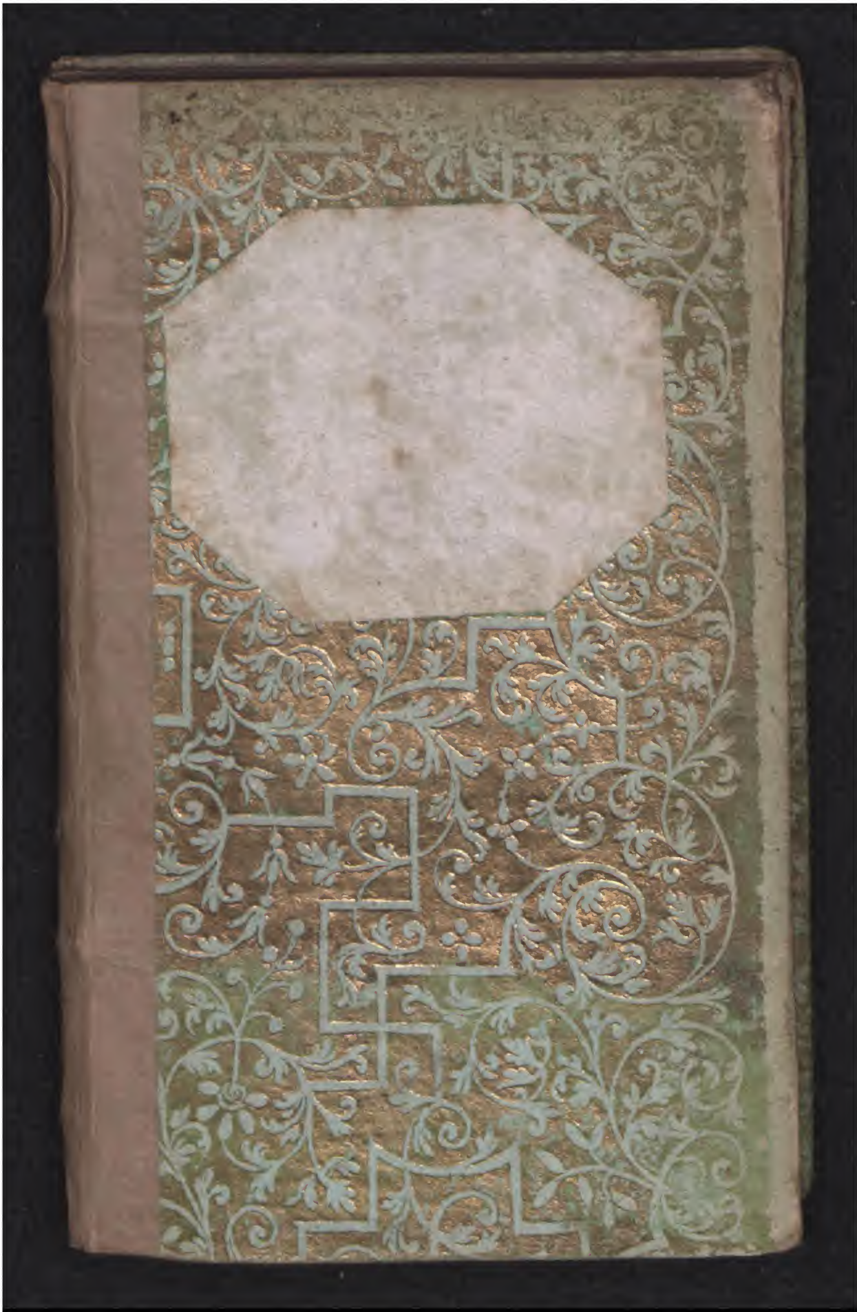
Hielmst. 2730 8° (LN 1664)