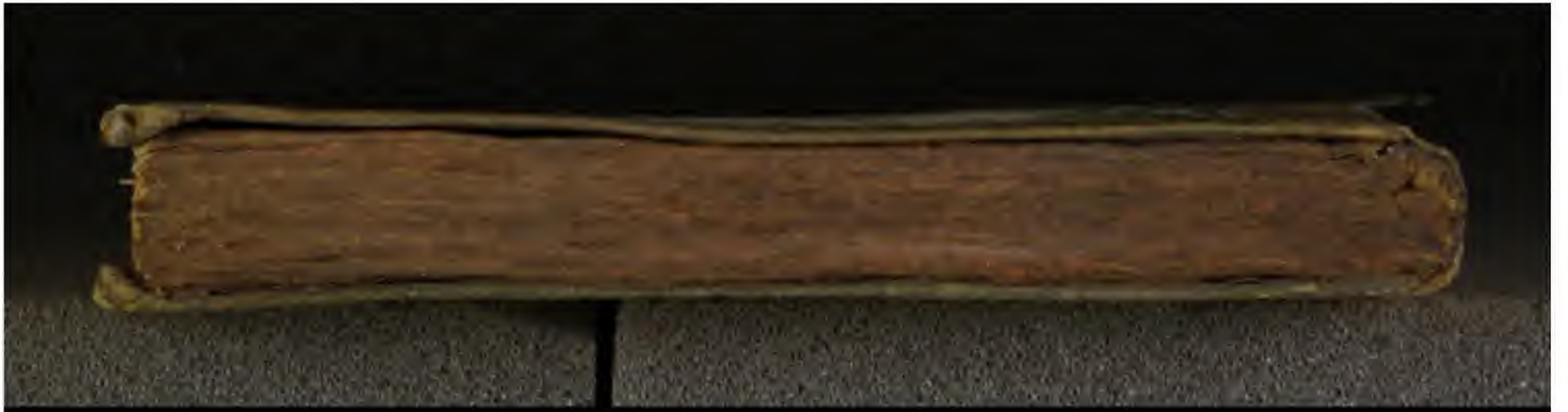
Early European Books, Copyright © 2010 ProQuest LLC. Images reproduced by courtesy of the Royal Library, Copenhagen. Hielmst. 2730 8° (LN 1664)