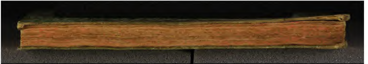
Early European Books, Copyright © 2010 ProQuest LLC. Images reproduced by courtesy of the Royal Library, Copenhagen. Hielmst. 2730 8° (LN 1664)