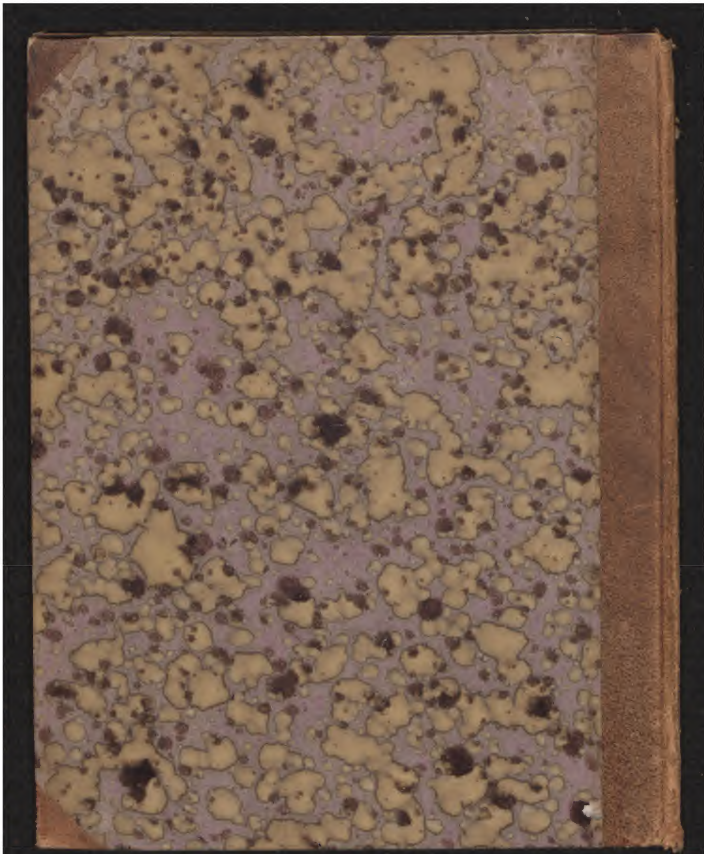
LN 797 4°