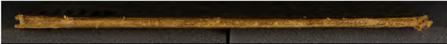
Early European Books, Copyright © 2009 ProQuest LLC. Images reproduced by courtesy of the Royal Library, Copenhagen. LN 797 4°