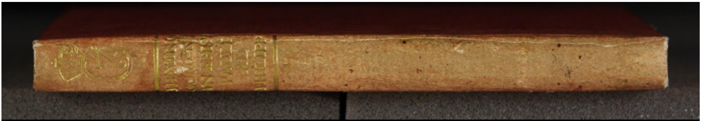
Early European Books LN 817 8° copy 1