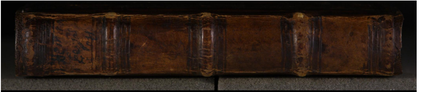
Early European Books, Copyright © 2009 ProQuest LLC. Images reproduced by courtesy of the Royal Library, Copenhagen. LN 821 8° copy 1