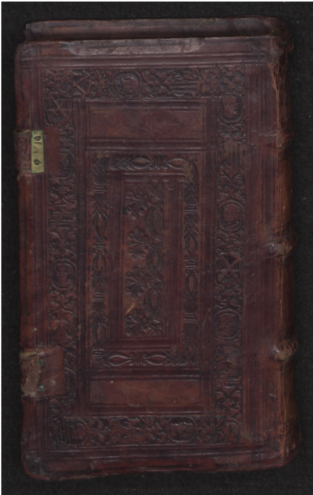
Early European Books, Copyright © 2009 ProQuest LLC. Images reproduced by courtesy of the Royal Library, Copenhagen. LN 821 8° copy 1