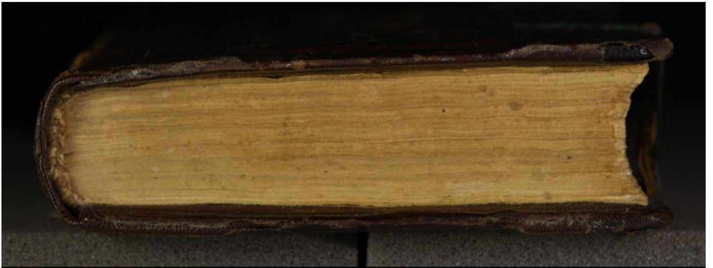
LN 821 8° copy 1