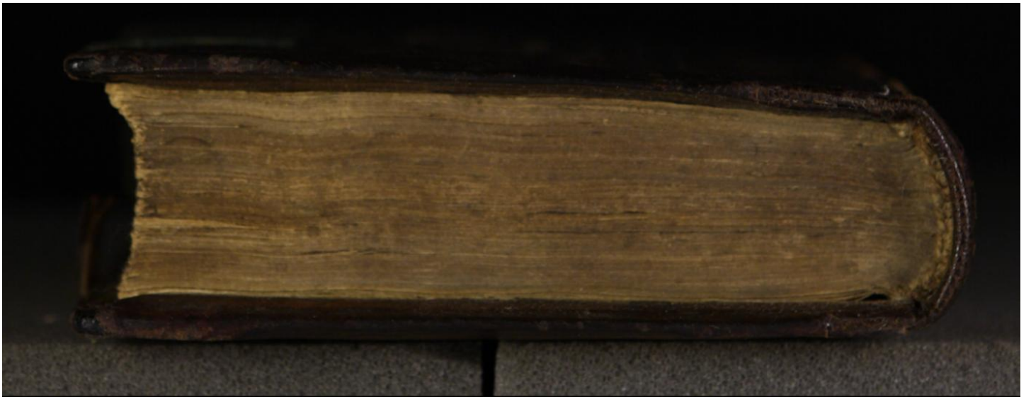
LN 821 8° copy 1