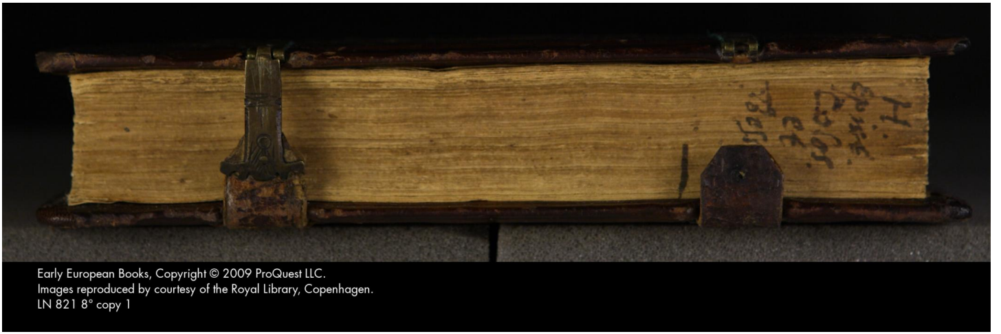
Early European Books, Copyright © 2009 ProQuest LLC. Images reproduced by courtesy of the Royal Library, Copenhagen. LN 821 8° copy 1