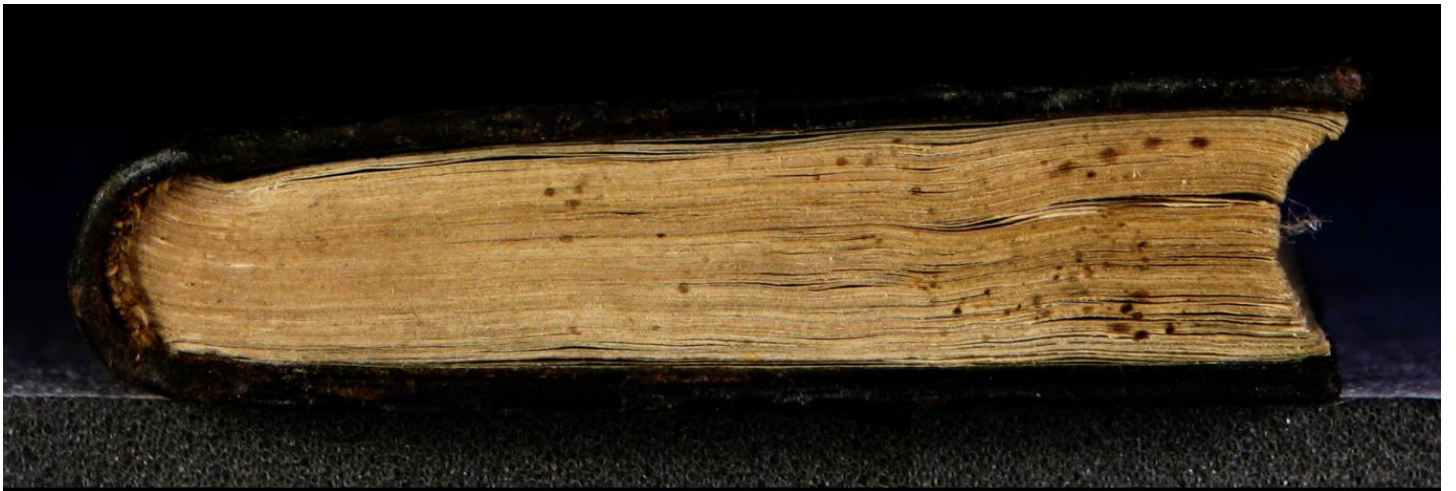
LN 812 8°