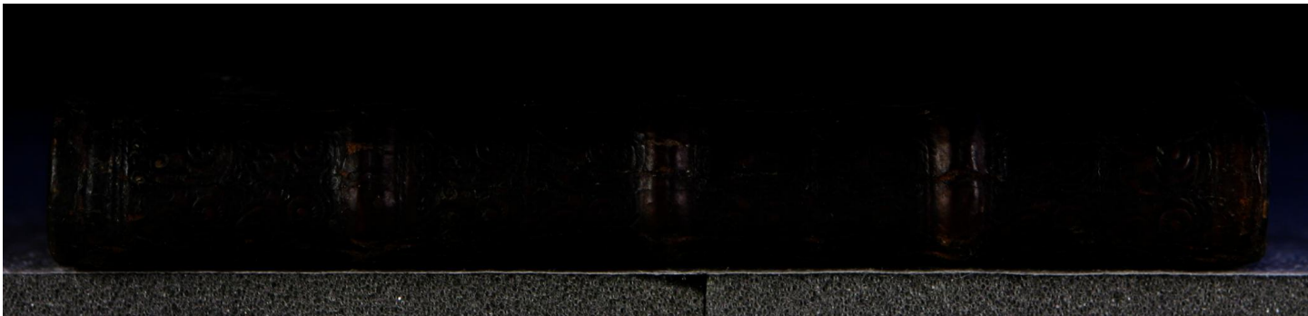
Early European Books, Copyright © 2009 ProQuest LLC. Images reproduced by courtesy of the Royal Library, Copenhagen. LN 812 8°