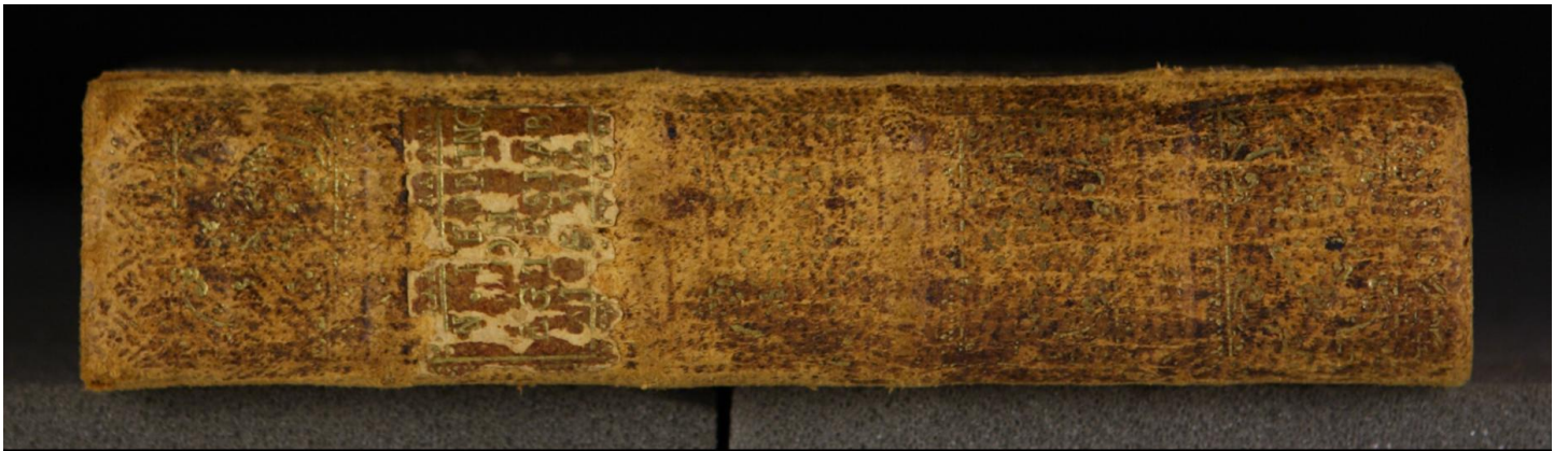
Hielmst. 765 8° (LN 856 8° copy 1)