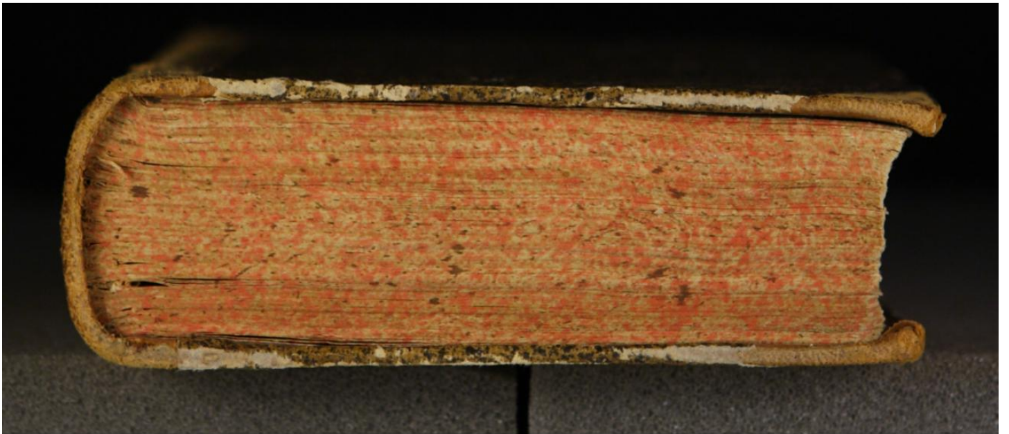
Early European Books, Copyright © 2009 ProQuest LLC. Images reproduced by courtesy of the Royal Library, Copenhagen. Hielmst. 765 8° (LN 856 8° copy 1)