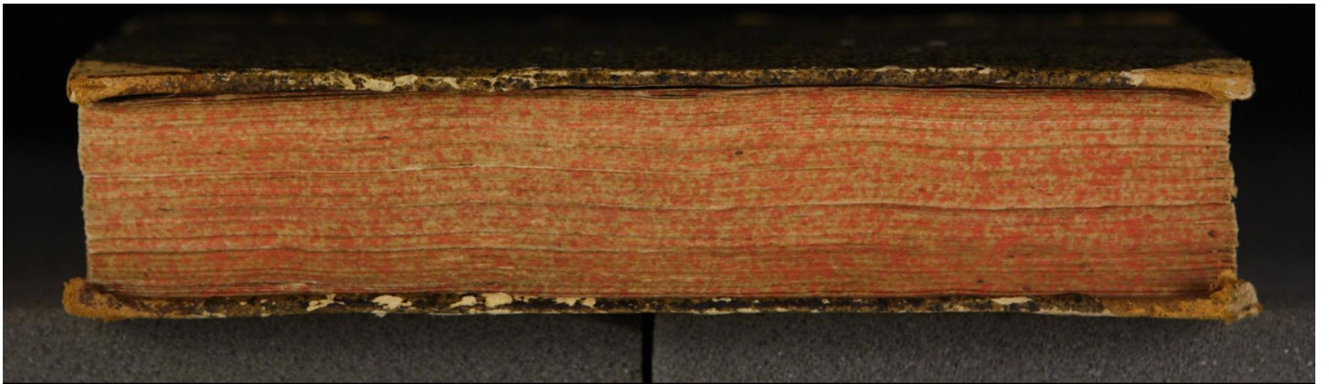
Early European Books, Copyright © 2009 ProQuest LLC. Images reproduced by courtesy of the Royal Library, Copenhagen. Hielmst. 765 8° (LN 856 8° copy 1)