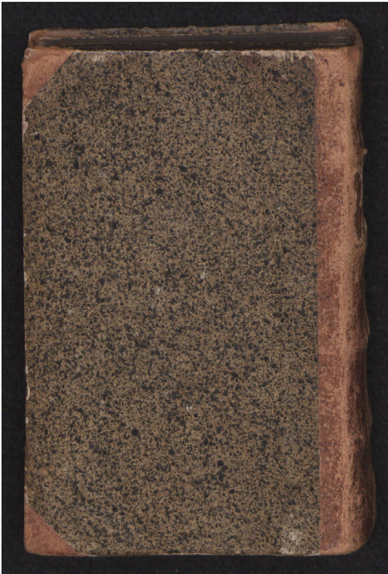
Hielmst. 765 8° (LN 856 8° copy 1)