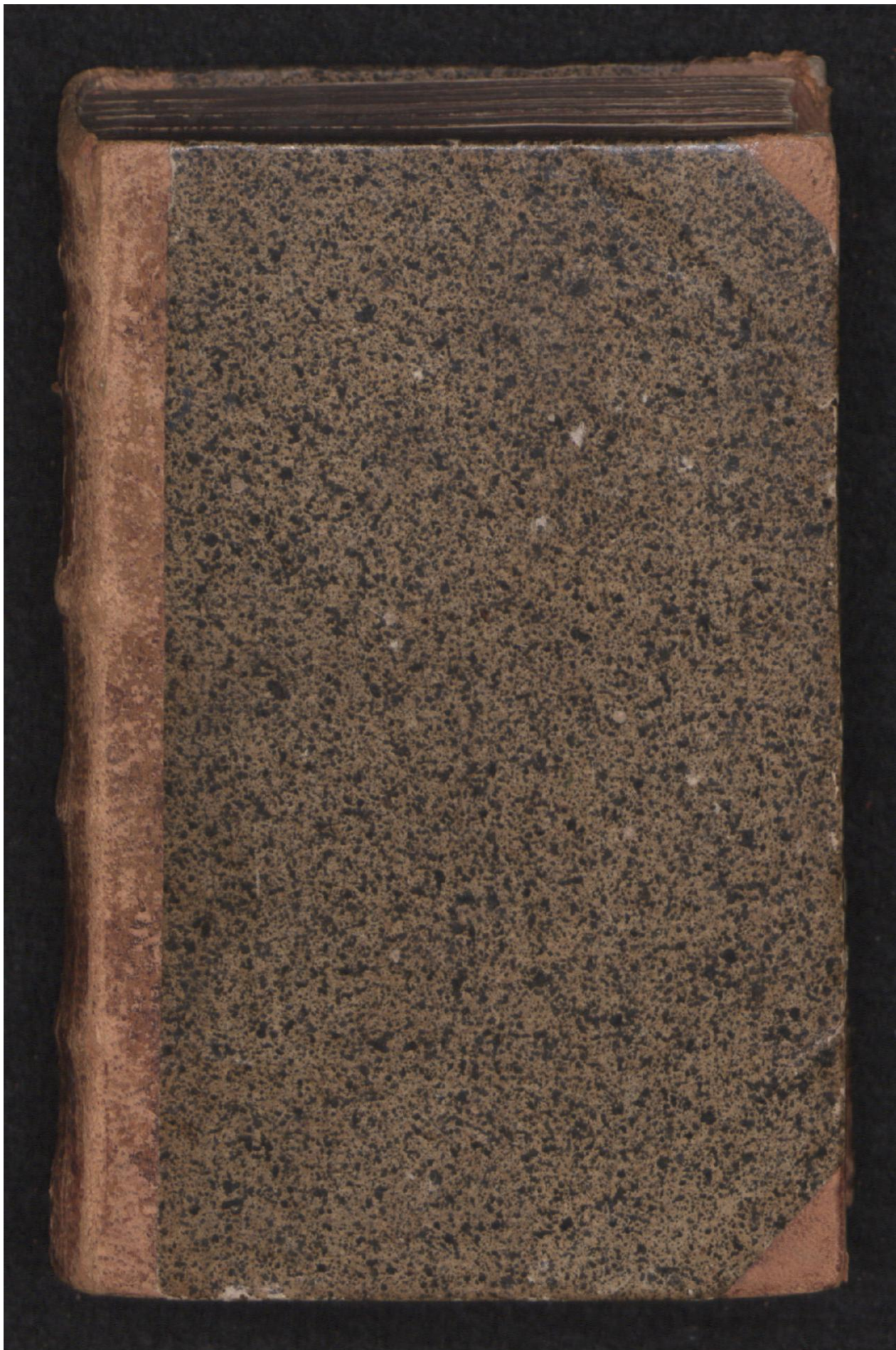
Hielmst. 765 8° (LN 856 8° copy 1)