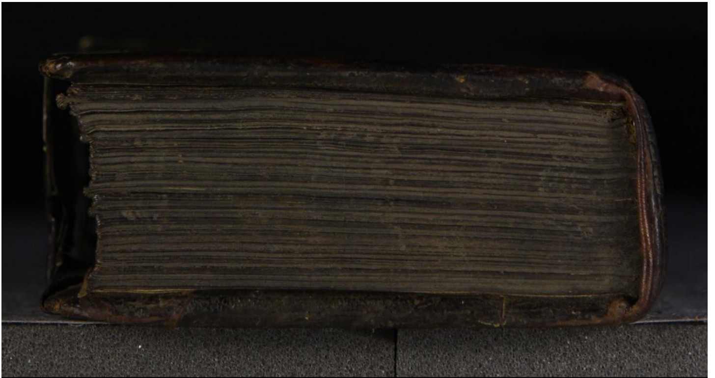
Early European Books, Copyright © 2009 ProQuest LLC. Images reproduced by courtesy of the Royal Library, Copenhagen. LN 903 8° copy 3