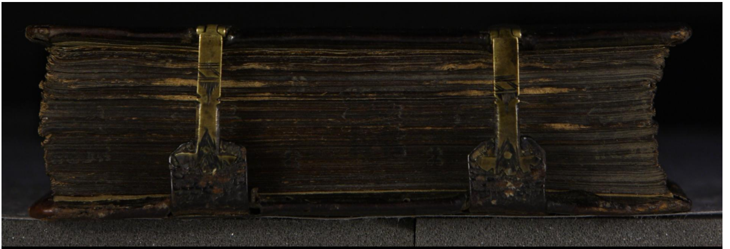
Early European Books, Copyright © 2009 ProQuest LLC. Images reproduced by courtesy of the Royal Library, Copenhagen. LN 903 8° copy 3