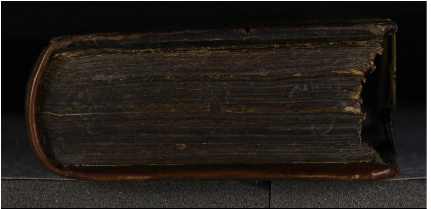
LN 903 8° copy 3