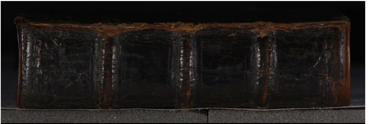
LN 903 8° copy 3