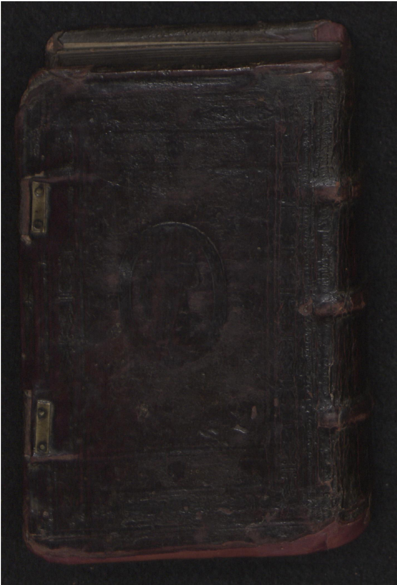
LN 903 8° copy 3