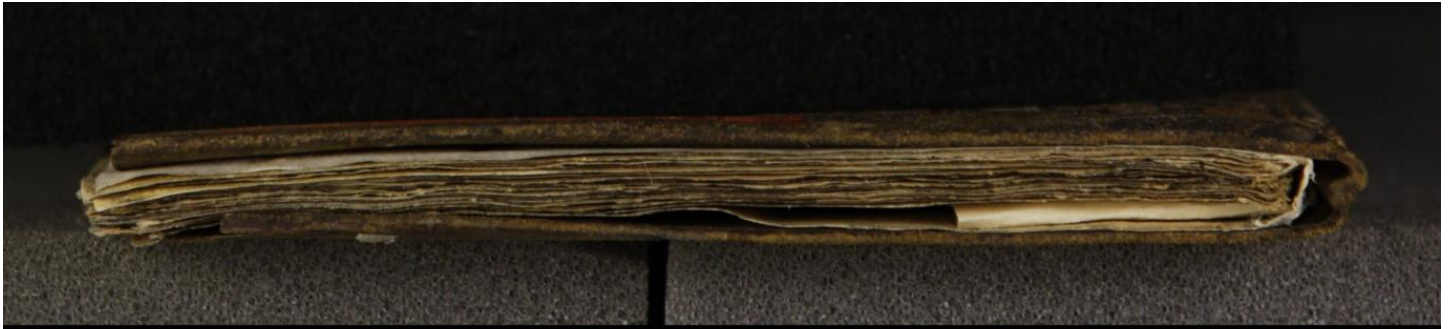
Early European Books, Copyright © 2009 ProQuest LLC. Images reproduced by courtesy of the Royal Library, Copenhagen. Hielmst. 527 8° (LN 746 8° copy 2)