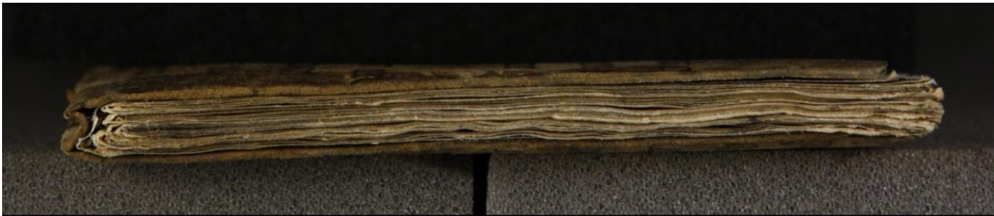
Hielmst. 527 8° (LN 746 8° copy 2)