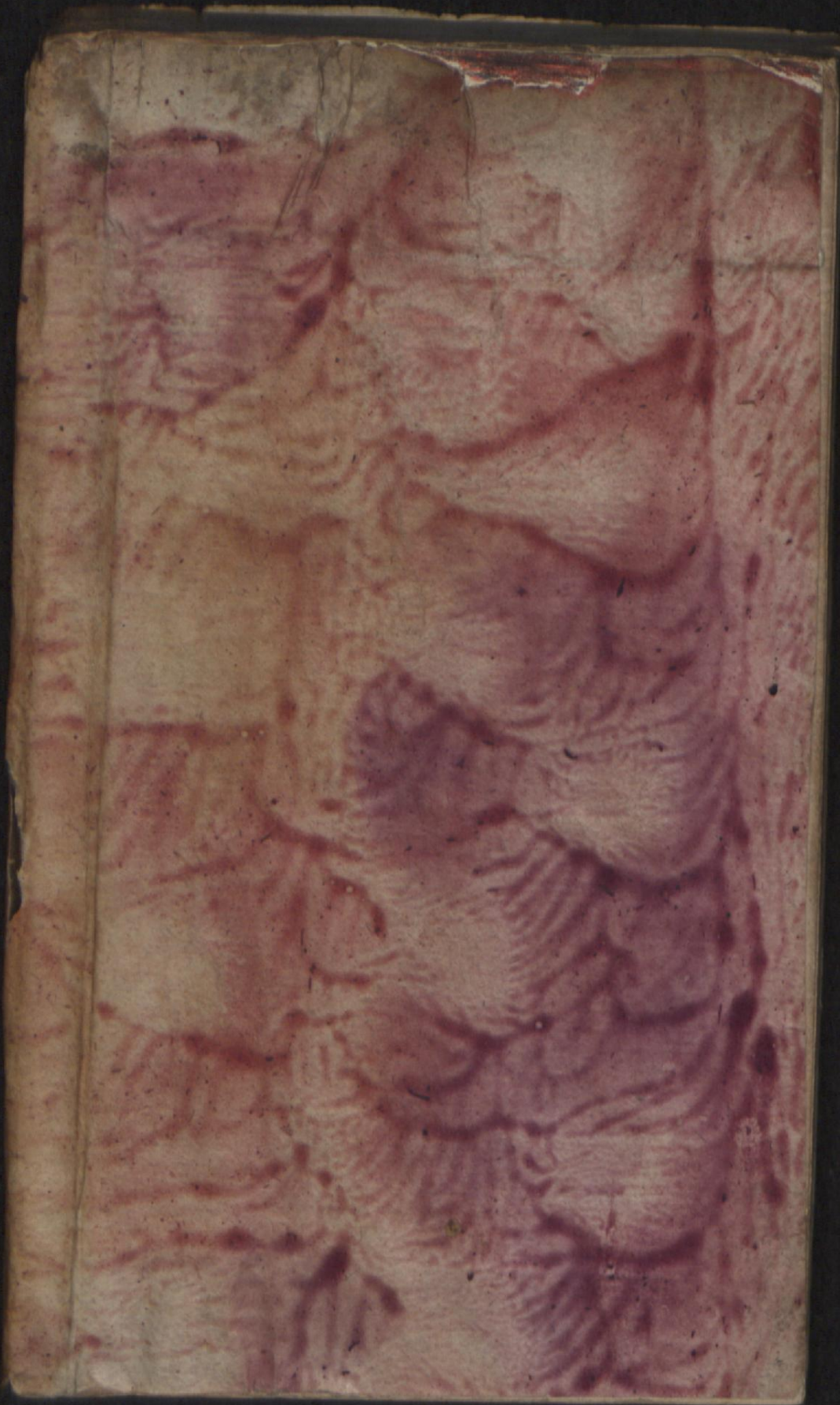
Hielmst. 198 8° (LN 811 8° copy 3)