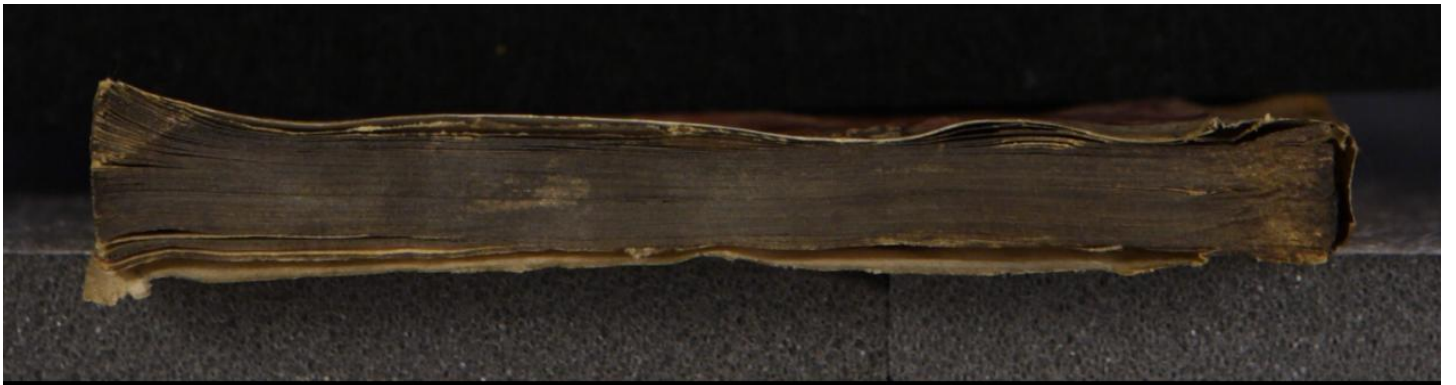
Hielmst. 198 8° (LN 811 8° copy 3)