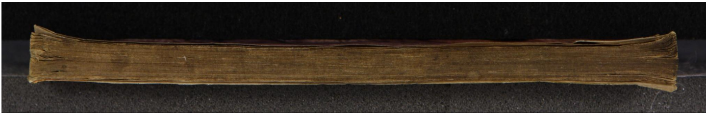
Early European Books, Copyright © 2009 ProQuest LLC. Images reproduced by courtesy of the Royal Library, Copenhagen. Hielmst. 198 8° (LN 811 8° copy 3)