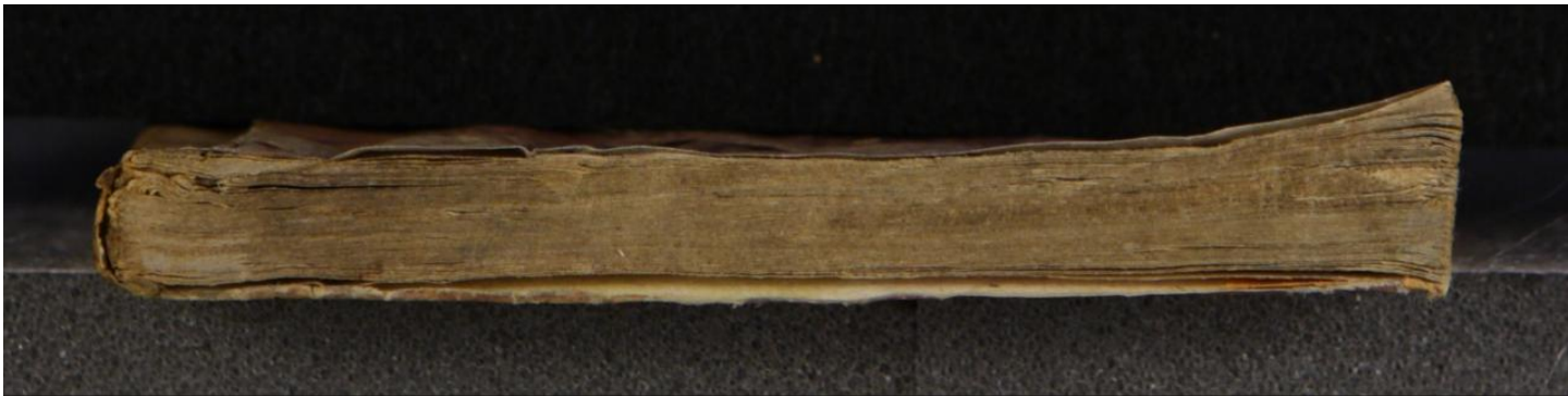
Early European Books, Copyright © 2009 ProQuest LLC. Images reproduced by courtesy of the Royal Library, Copenhagen. Hielmst. 198 8° (LN 811 8° copy 3)