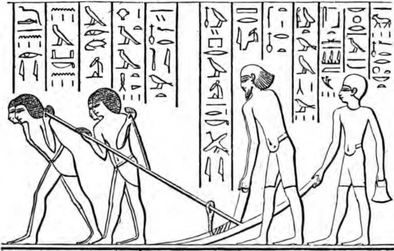
Abb. 9. Semitischer Sklave*) (wahrscheinlich ein kriegsgefangener Hyksos) bei der Feldarbeit (Darstellung des 17. vorchristl. Jahrhunderts).

hethitischen Großmacht, mit welcher der Pharaon nach schweren Kämpfen eine Allianz 29) abschloß, die den beiderseitigen Interessen entsprach. Wir wissen noch recht wenig über die politischen Verhältnisse Vorderasiens in dieser Zeit. Wenn wir aber sehen, wie bald