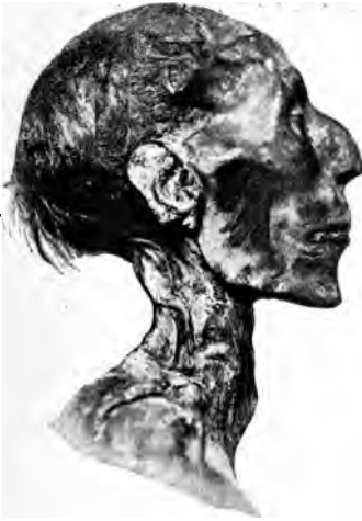
Abb. 8. Kopf der Mumie Ramses' II.

Seite ist von einer Gefährdung des ägyptischen Staates keine Rede. Der Pharao führt unbekümmert um diese Vorgänge seine Reformation in der Religion und Kunst durch — auch in dieser Zeit wird niemand den Aufenthalt semitischer Stämme in Gosen für bedenklich gehalten haben. War doch das eigentliche Ägypten in keiner Weise durch jene internen syrischen Fehden bedroht, in welche sich einzumischen Amenophis IV. keine Neigung verspürte. Die händelsüchtigen Kleinfürsten