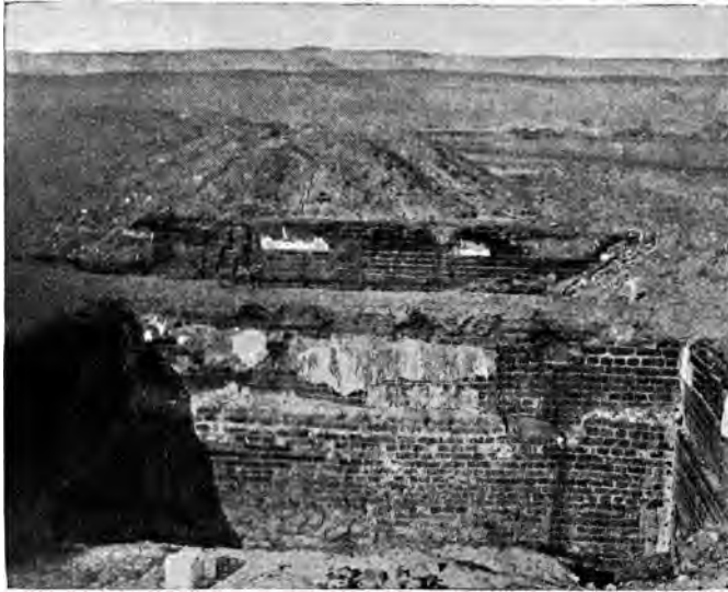
Abb. 2. Vorratskammer von Pithom. (Seite 27.)

Daß die verschiedenen Quellen des alten Testaments von dem Aufenthalt Israels in Ägypten nur eine sagenhafte Erinnerung bewahrt haben, steht heute fest. Es genügt, darauf hinzuweisen, daß die betreffenden Berichte durchaus alle Merkmale der Sage an sich tragen. Vergeblich fragen wir nach einer Zeitbestimmung, nach historisch nachweisbaren Persönlichkeiten. Wo wir z. B. in Ägypten den Namen eines Königs erwarten, wird von dem König schlechthin gesprochen. Denn nichts andres heißt ja Pharao, „das große Haus“ (per-o), wie der Ägypter seinen Herrscher bezeichnete, ähnlich wie der Türke seine Regierung die Hohe Pforte nennt. Erst in den alttestamentlichen