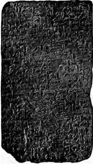
Abb. 6. Thontafelbrief des Abdchiba von Jerusalem an den König von Ägypten (um 1400 v. Chr.).

Weltreich, und ähnlich diesen waren sie ein Konglomerat von Stämmen, welche die gleiche jugendliche Eroberungslust und wohl auch die Rassengemeinschaft zusammengeführt hatte. Unter diesen Chabiri waren auch „Hebräer“, so z. B. der von Merneptah besiegte Stamm Israel und der Stamm Asser, den wir um 1300 v. Chr. unter Sethos I. und Ramses II. in Nordpalästina antreffen 27) . Wir kennen