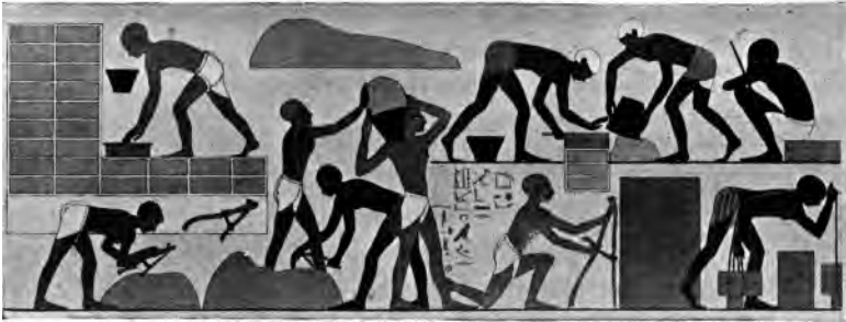
Abb. 9. Kriegsgefangene Asiaten beim Ziegelstreichen unter Aufsicht eines Fronvogts*). (Darstellung aus dem 15. vorchristl. Jahrhundert.)

Wie dem auch sei, die politische Lage Ägyptens war unter Ramses II. ernst geworden, der Aufenthalt eines semitischen Stammes im Delta an der Einfallsstraße nach Syrien zu verlor sein harmloses Aussehen und erforderte aufmerksamere Beobachtung. Das freundliche Wohlwollen, mit dem die Regierung vorher die kleine semitische Enklave behandelt hatte, mußte sich in Mißtrauen verwandeln, das sich schließlich in feindseligen Maßnahmen äußerte. Die alttestamentlichen Quellen wissen zu erzählen, daß der neue Pharaο, der von Joseph nichts wußte, die Israeliten zu Sklavenarbeiten zwang. Sie mußten Ziegel streichen [Abb. 10] und Feldarbeit [Abb. 9] tun, wie die kriegsgefangenen Sklaven, die uns auf den ägyptischen Monumenten begegnen.