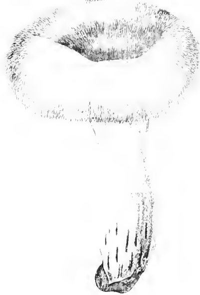
Agaricus Necator Bulliard