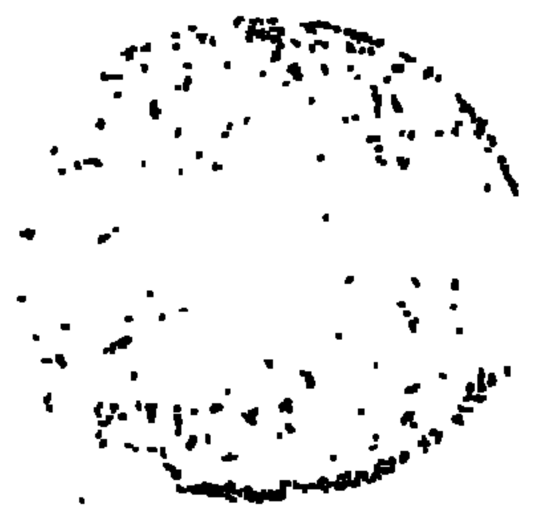
صورة من المخطوط