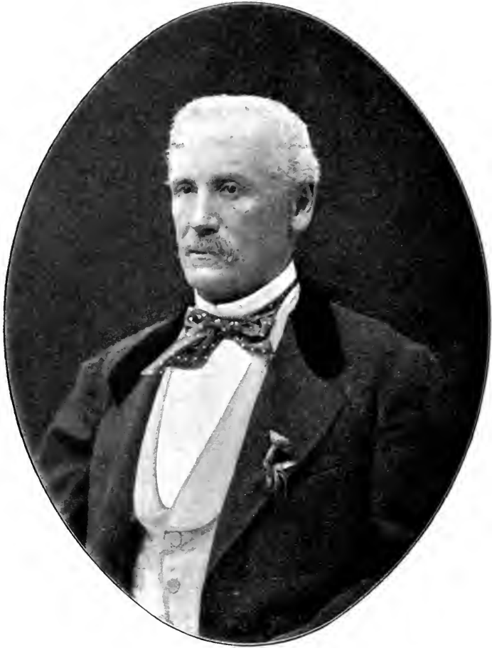
FRANCISCO SOLANO ASTA-BURUAGA.