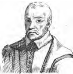
Faur. (Croy du)