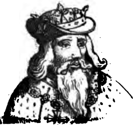
VI. Edouard III.