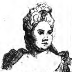
II. Duclou .