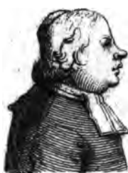
Epée. (l'abbé de U)