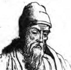
II. Euclide .