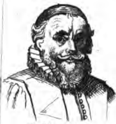
II. Drusius .