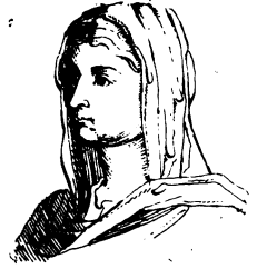
Faustine. (la Jeune)