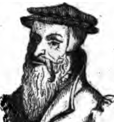
VII. Etienne VI .