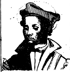
Ives (S. t. )