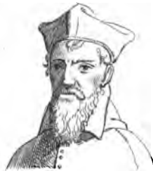
Joyeuse (François de)