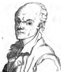
Lalande (Jérôme de)