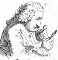
Justieu (Bernard de)