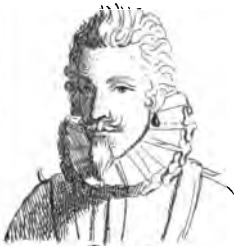
Joyeuse (Anne de)