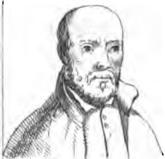
Ignace (de Loyola)