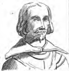
Jean II. (Duc de Braganca)