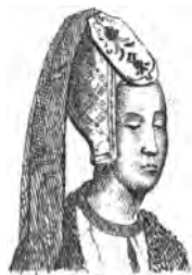
Isabelle de Baviere