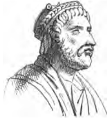
Julien dit l'Apostat