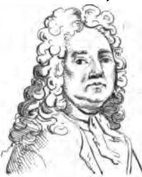
Largilliere (Nicolas de)