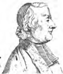
Lanquet (J.B. J.G.)