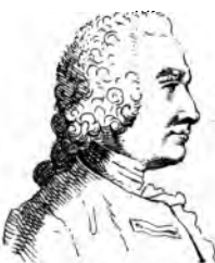
Lassone (J th M ie F ois )