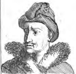
Jean sans peur