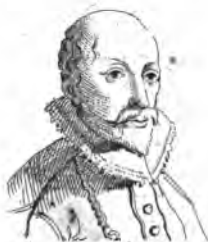
Lassus (Orlando de)