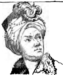
Kain (Henri Louis le)