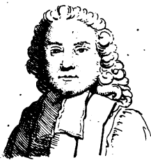
Lamoignon (Chrétien Maleherbes)