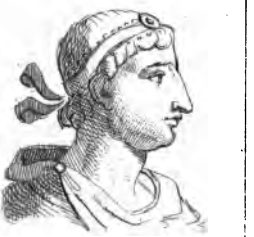
Jovien ( Flavius )