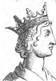
Jeanne de Naples