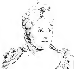
II. Duclot .