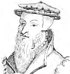
VII. Etienne II .