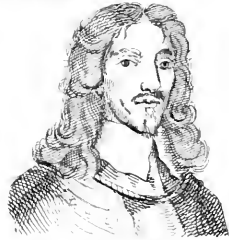
II. Fairfair .