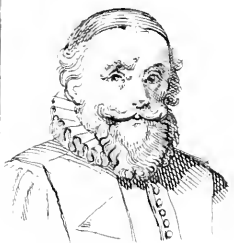
II. Drusius .