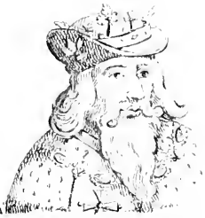
III. Edouard III.