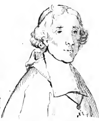
II. Fenelon .