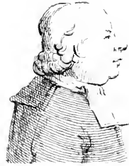
Epée. (l'abbé de U)