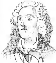
II. Falconnet .