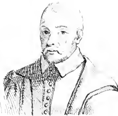
Faur . (cinq du)