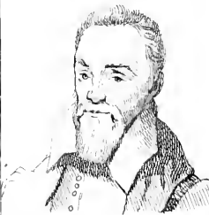
III. Feure .