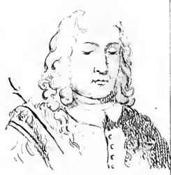
Ferdinand V .