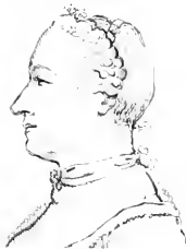
II. Fawart .