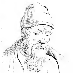
II. Euclide .