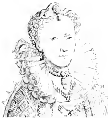
Elisabeth. (Reine d'Anglet.)