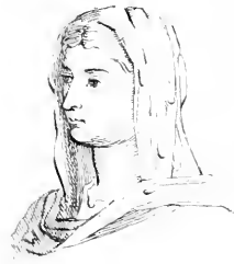
Faustine . (la Jeune)