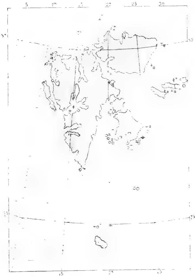
Verteilung der Arten der Gattung Hippolyte um Spitzbergen im Sommer 1898.

Näheres über die geographische Verbreitung ist jedesmal bei den betreffenden Arten angeführt.