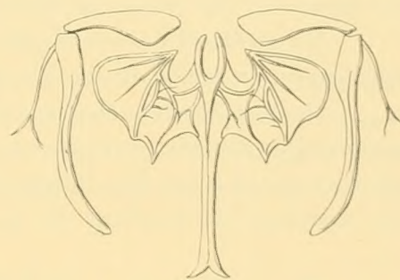
Fig. 2. Notommata brachiata nsp. Kiefer. Nach Reich. Oc. 5. Obj. 7.

Der Darmkanal ist vollständig, d. i. es fehlt daran die Afteröffnung nicht. Der Kaumagen ist kräftig, die beiden Hämmer und der Ambos gut sichtbar. Den Stiel der Hämmer bildet ein Kuti-