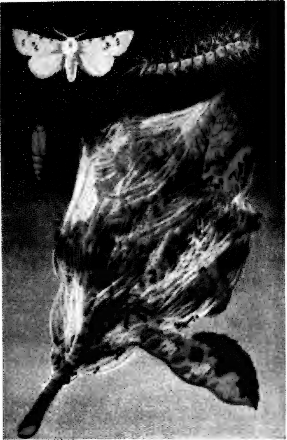
美國七斑 (Hyphantria cunea Drury)