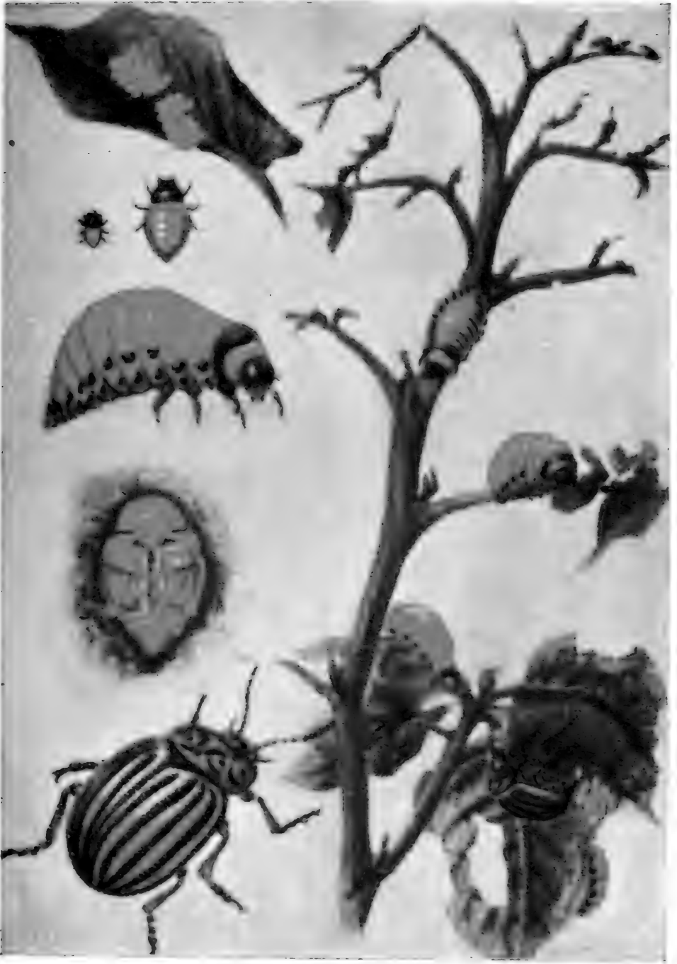
馬鈴薯甲虫 ( Leptinotarsa decemlineata Say)