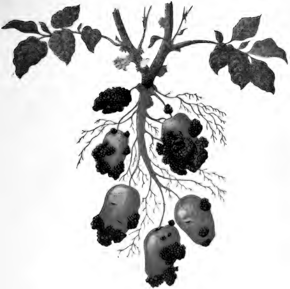
馬鈴薯癭腫病 ( Synchytrium endobioticum (Schilb) Perc)