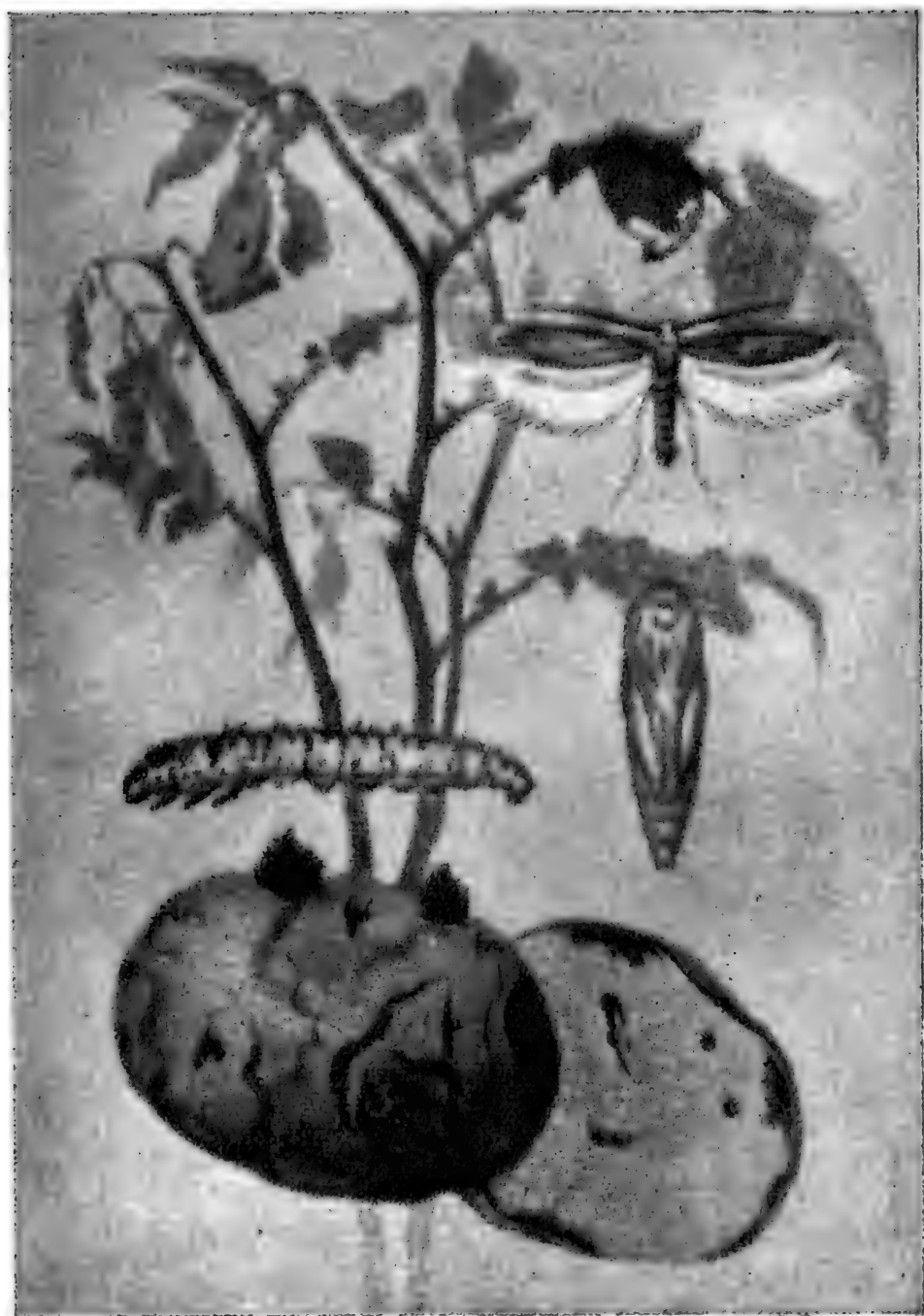
馬鈴薯塊莖蟲 ( Phthorimaea operculella Zell)