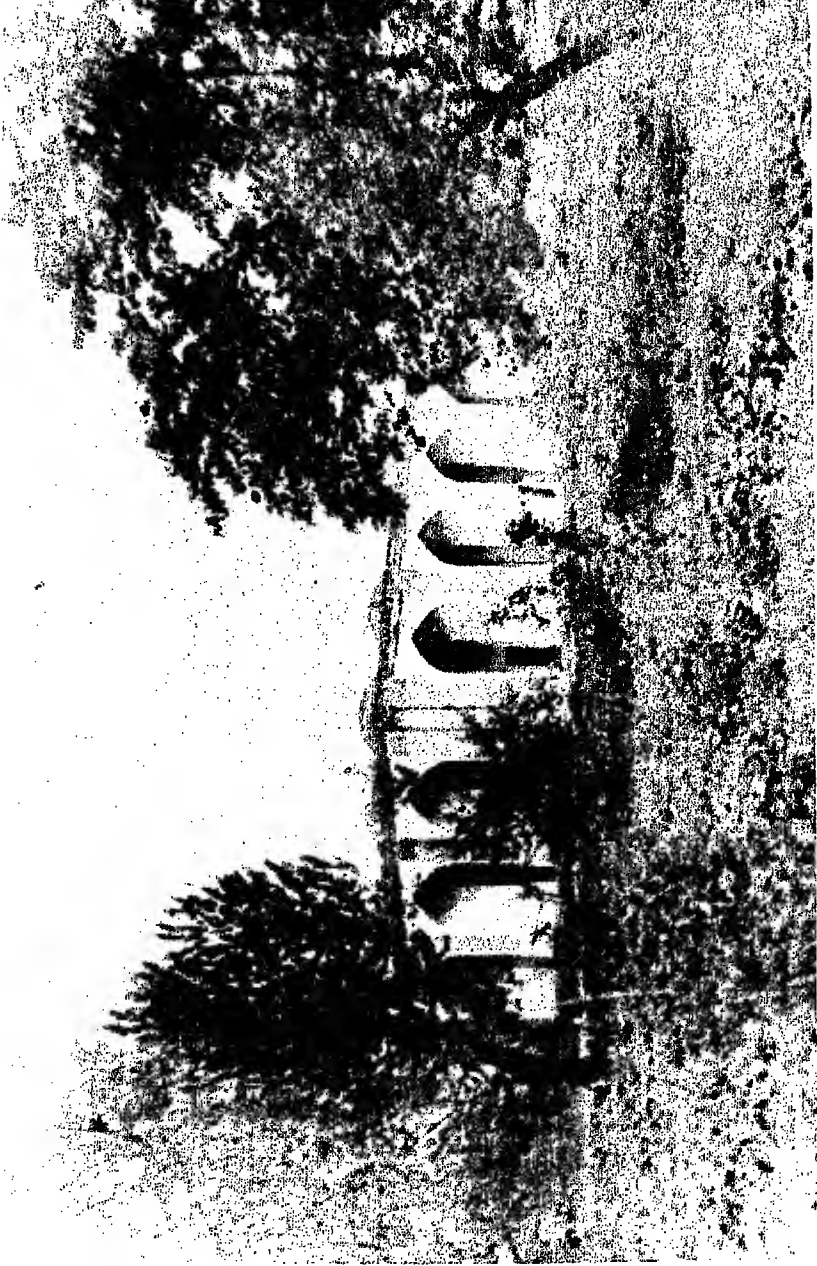
مسرح القصة : مسجد الأمام البخاري في قرية غزنفك قرب بصره