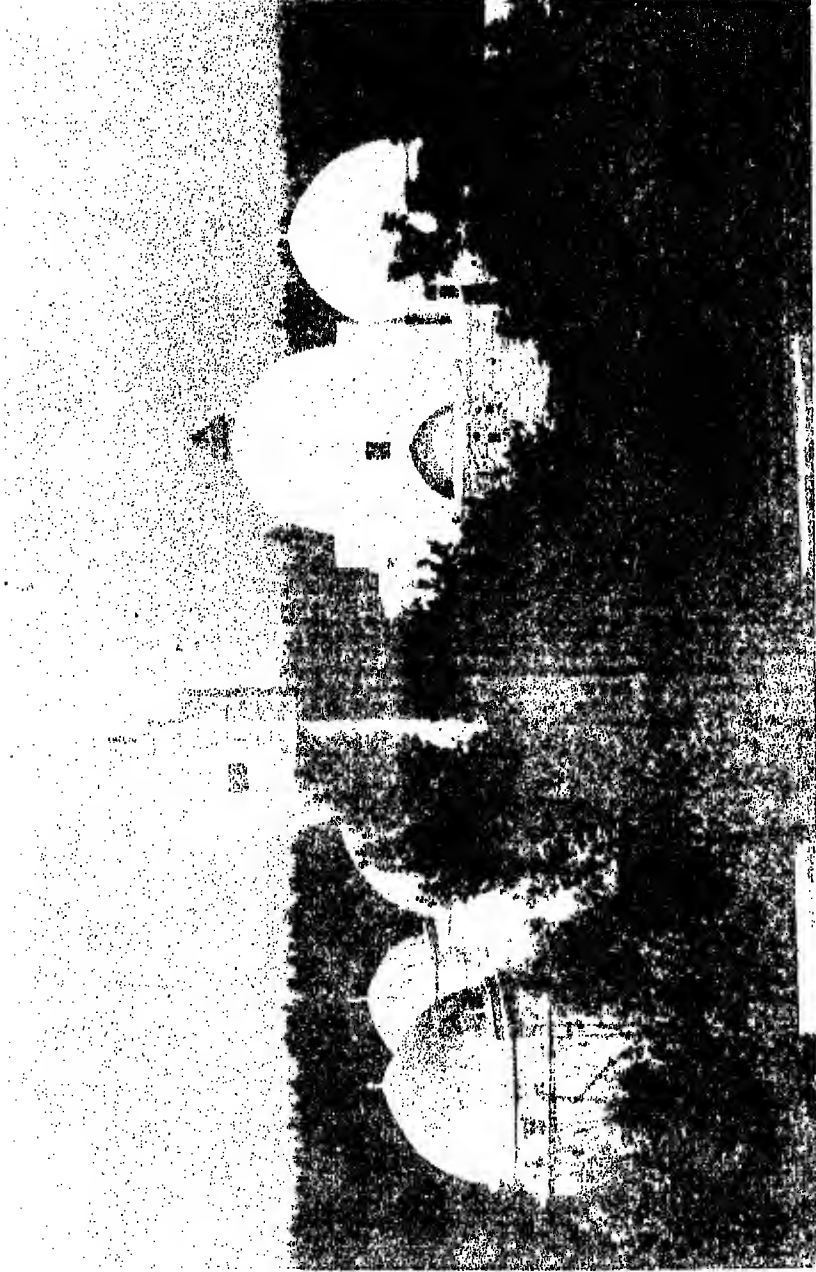
مسجد القصة : مسجد الامير (عليه السلام) في كربلاء