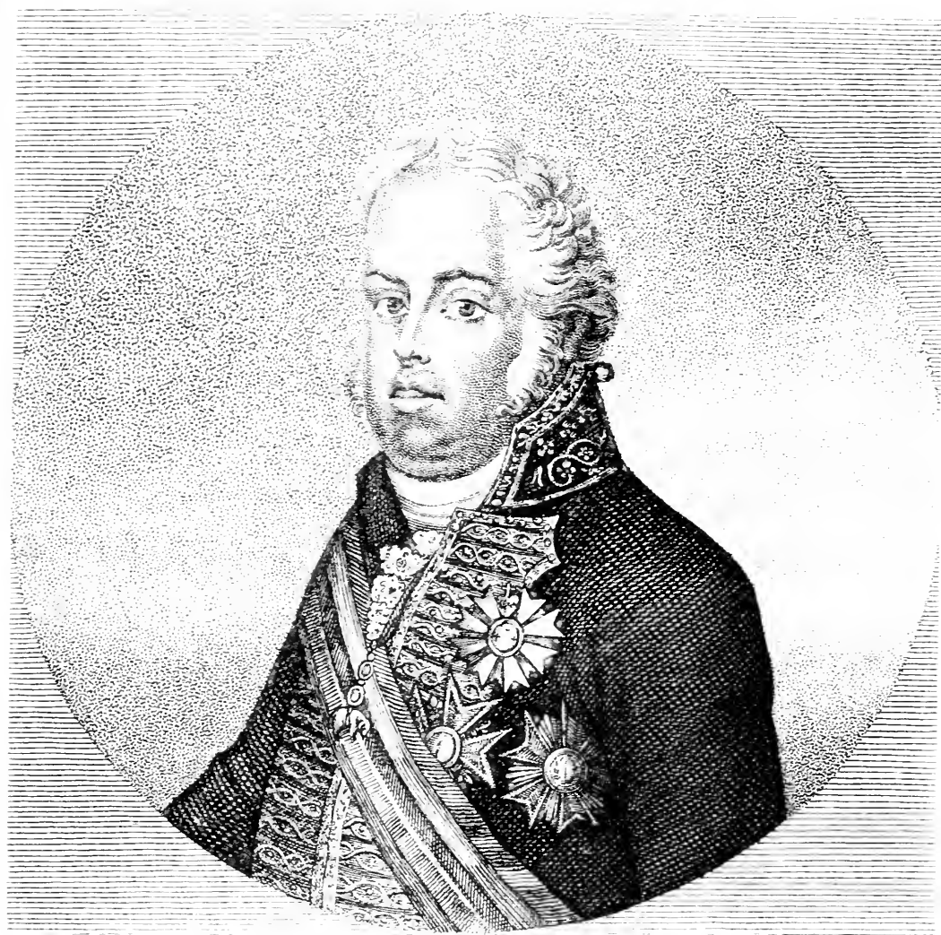
El Rei D. João VI