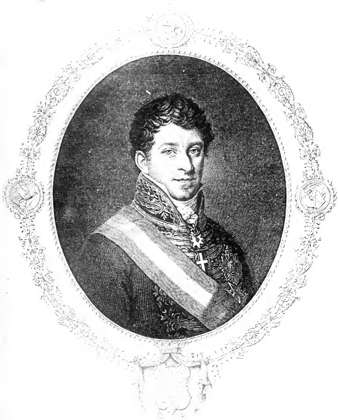
Conde de Palmella