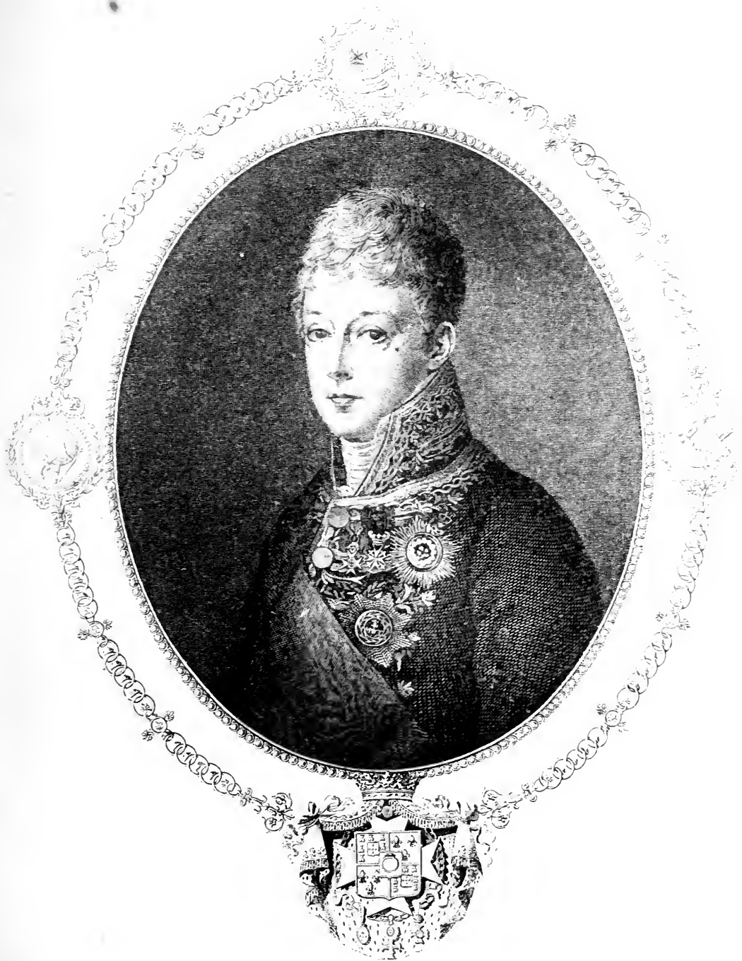
Marques de Murintua