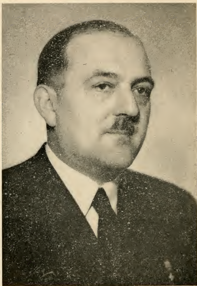
Генерал А. В. ТУРКУЛ в 1939 году