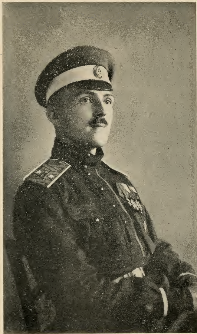
Генерал А. В. ТУРКУЛ в 1920 году