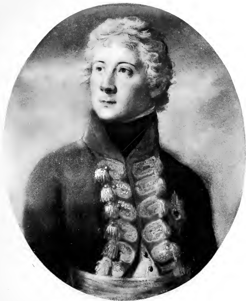
Prinz Louis Ferdinand von Preußen