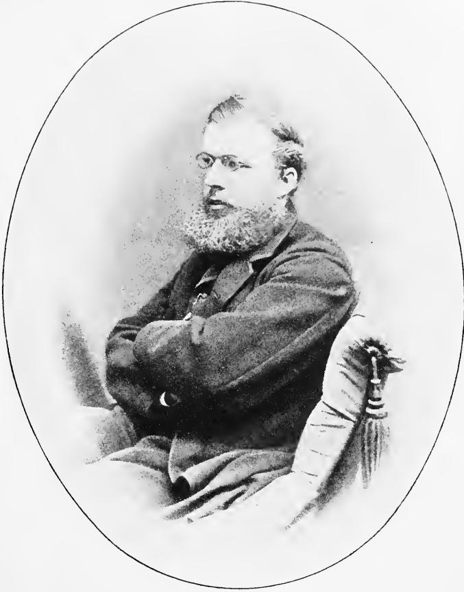
Graf Wolf Yorck von Wartenburg (1870)