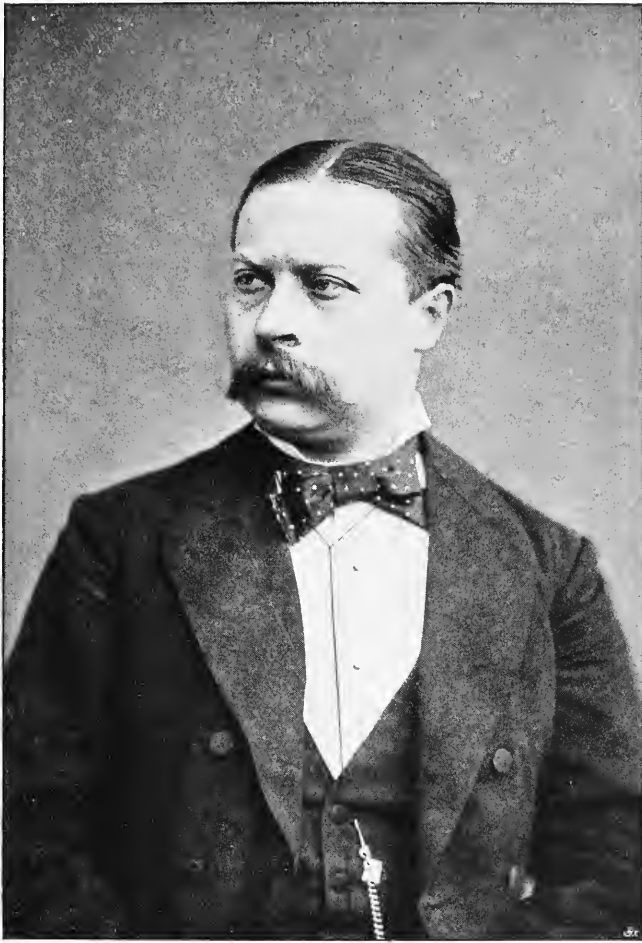
Ernst von Wildenbruch