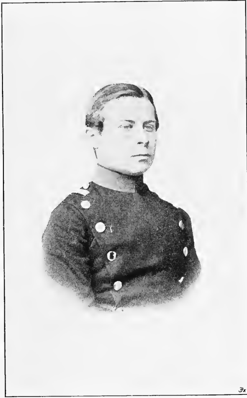
Ernst von Wildenbruch (1865)