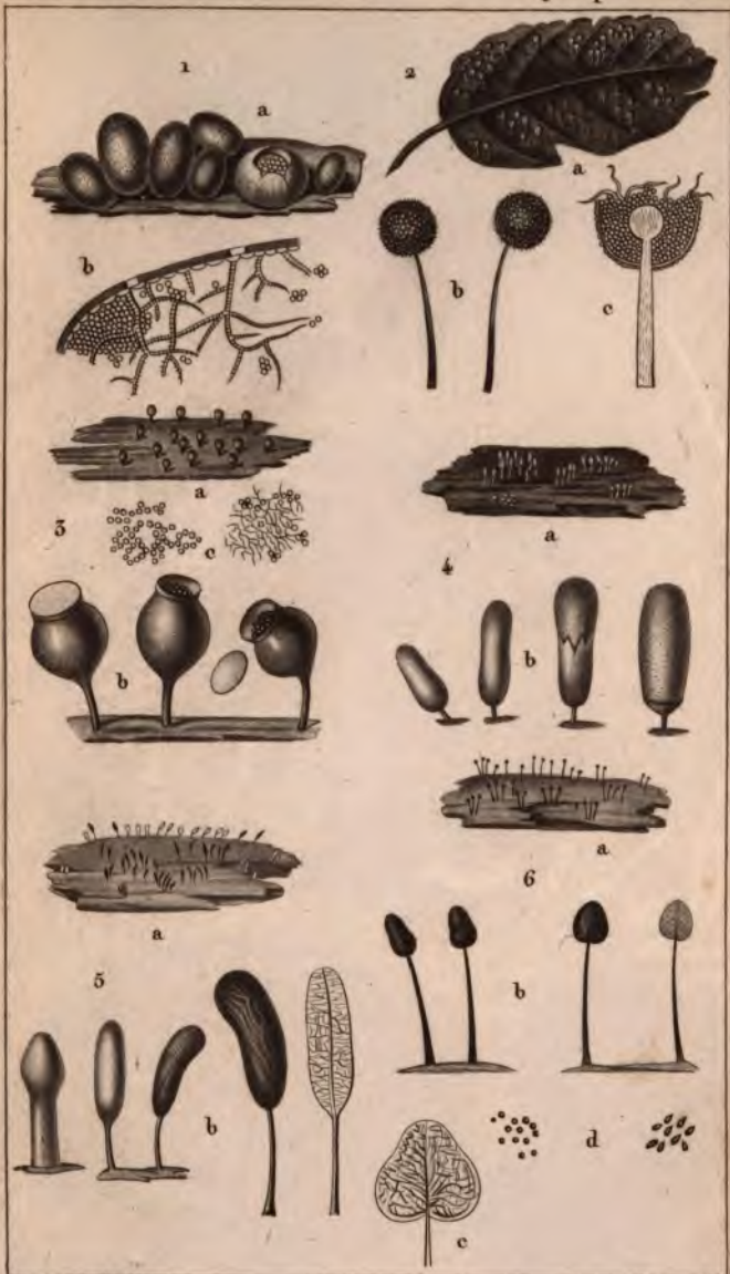
Turpin pinus? et dirac?