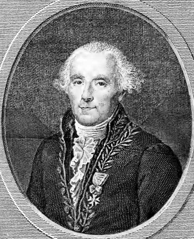
P. S. LAPLACE.