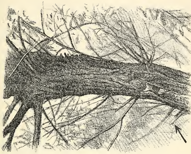
Nisthöhle von Parus Salicarius.