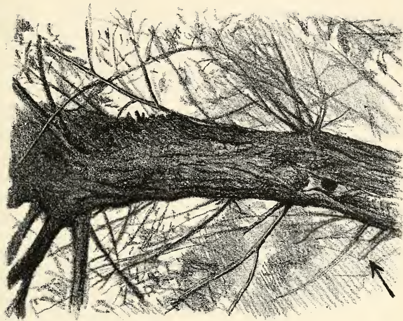
Nisthöhle von Parus Salicarius . Zum Artikel von W. Hagen (pag. 53).