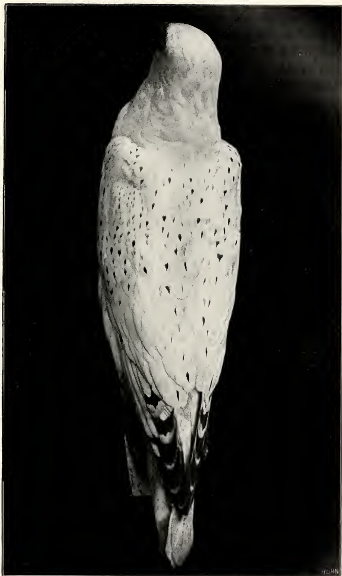
Weißer Jagdfalke, erlegt am 19. Januar 1909 auf Sylt.