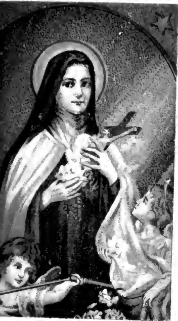
S. THERESINHA DO MENINO JESUS