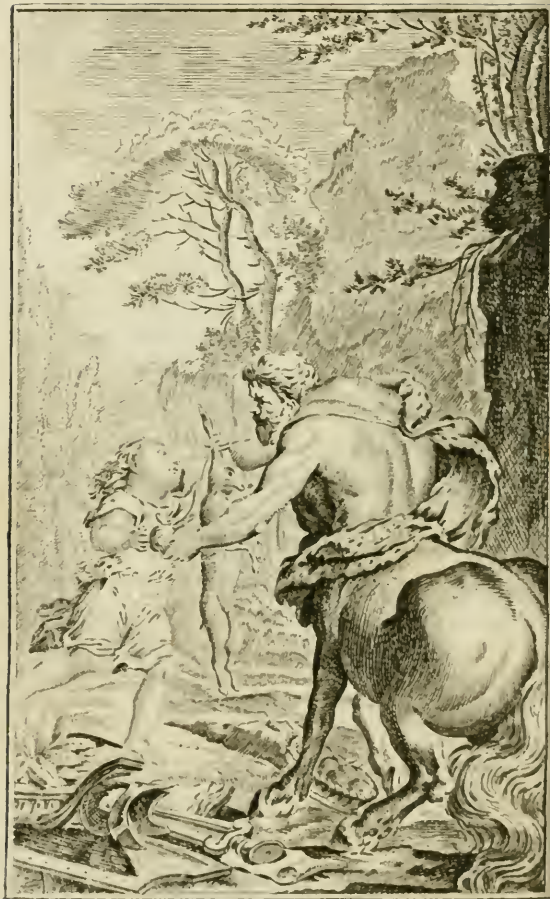
Chiron exerce Achille à la Course.