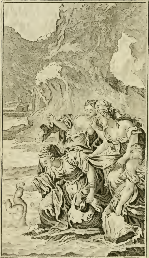
Thetis plonge Achille dans le Styx.