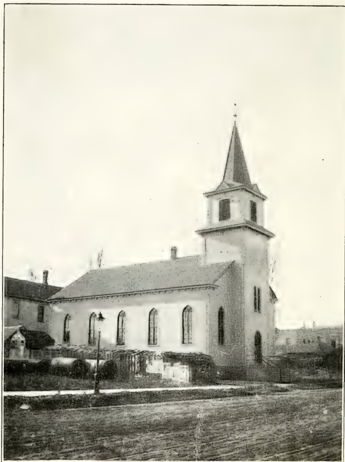
Den Tysk Lutherske Treenigheds Kirke, Niende Avenue og Fjerde Street Syd, hvor Vor Frelzers Menighed blev stiftet den 6te December 1869.