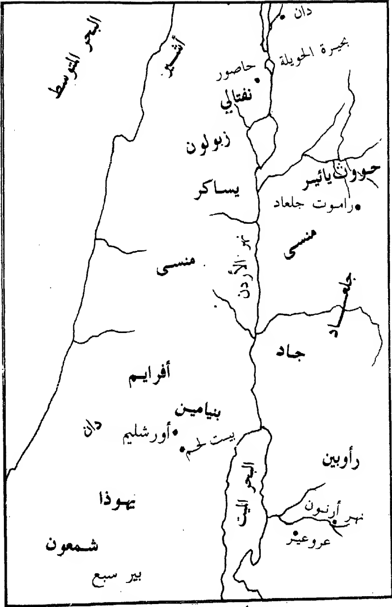
تقسيم أرض كنعان بين الأسباط