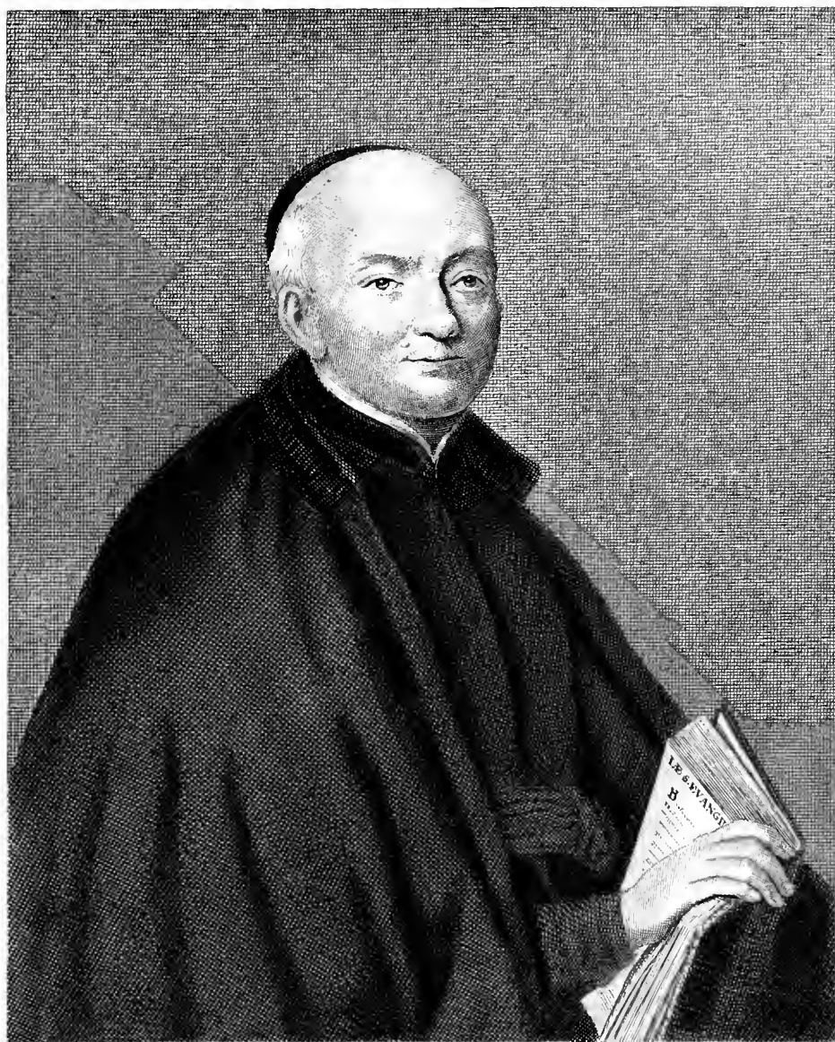
Le R. P. DOMINIQUE BOUHOURS de la Compagnie de Jesus ne a Paris, y est mort le 27. de May 1702. age de 73. ans.

Aux charmes d'un genie aise, poli, sublimé Bouhours joingt encor la bonté, la candeur Si des plus beaux esprits il satura l'estime D'une foule d'amis il s'attacha le cœur.