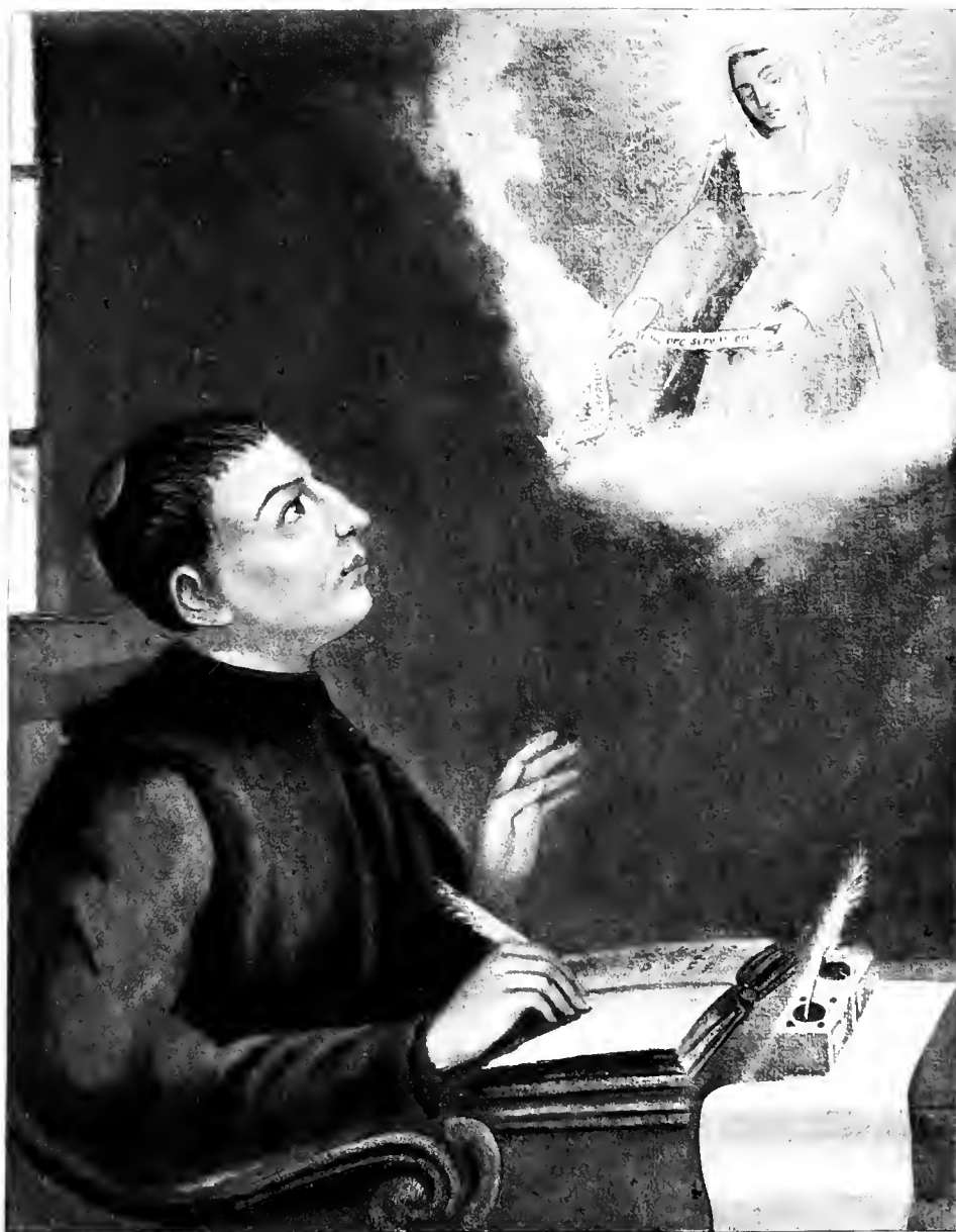
Reproducción fotográfica del retrato del Vble. P. Jose de Ancheta, jesuita, nacido en la Laguna de Tenerife en 1533 y muerto en el Brasil, donde es llamado "el Apostol", en 1597