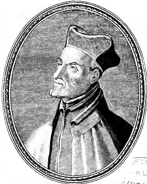
P. NICOLAUS BOBADILLA Palentinus, uiras e primis decem IGNATHII Socijs. Obijt Laureti IX. Kalend. Octobris, anno Domini CIO. IO. XC.

Hic Parcas sine mente sonos, sceptrumq; Tuarum Immoto ridet cuncta supercilio.