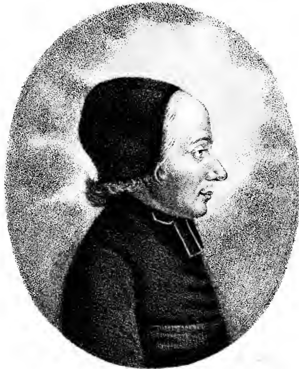
LE PÈRE BEAUREGARD de la Compagnie de Jesus.