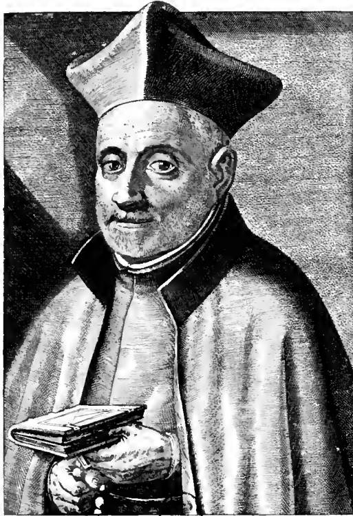
CLAVDIVS AQAIVIVA NEAPOLIT. V. GENERALIS Praepositus Societatis IESV. quam 32 annos feliciter rexit, Religiosa morum comitate atq; industria. Quocuit in Dom an 1615 31. Iuniar. Aetat 74 Con Gratia et Privilegio. Parmans.