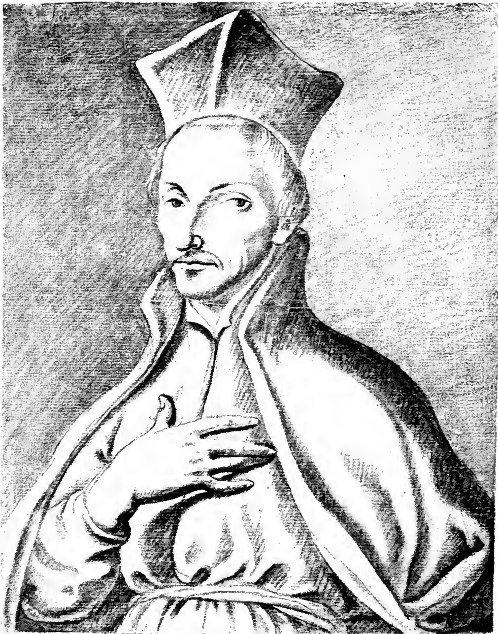
P. MARTINVS BECANVS