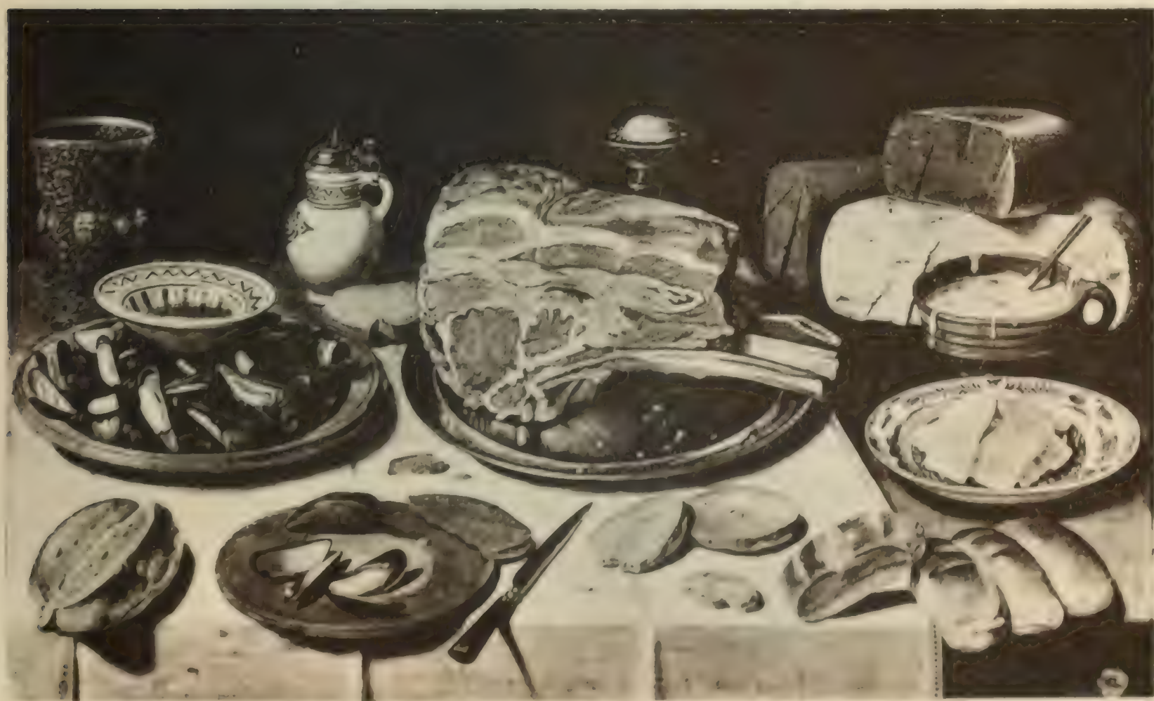
Nr. 25. CLARA PEETERS