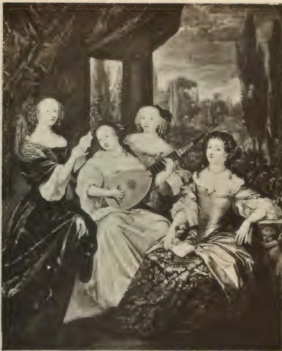
Nr. 50. CONSTANTIJN NETSCHER.