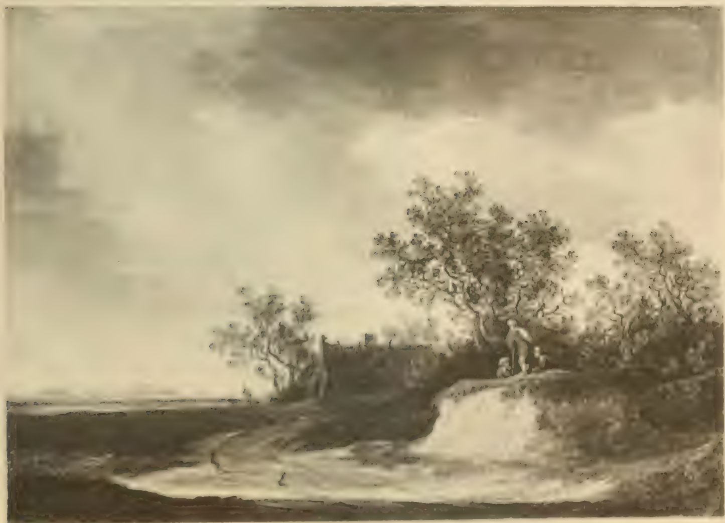
Nr. 107. JAN van GOIJEN.