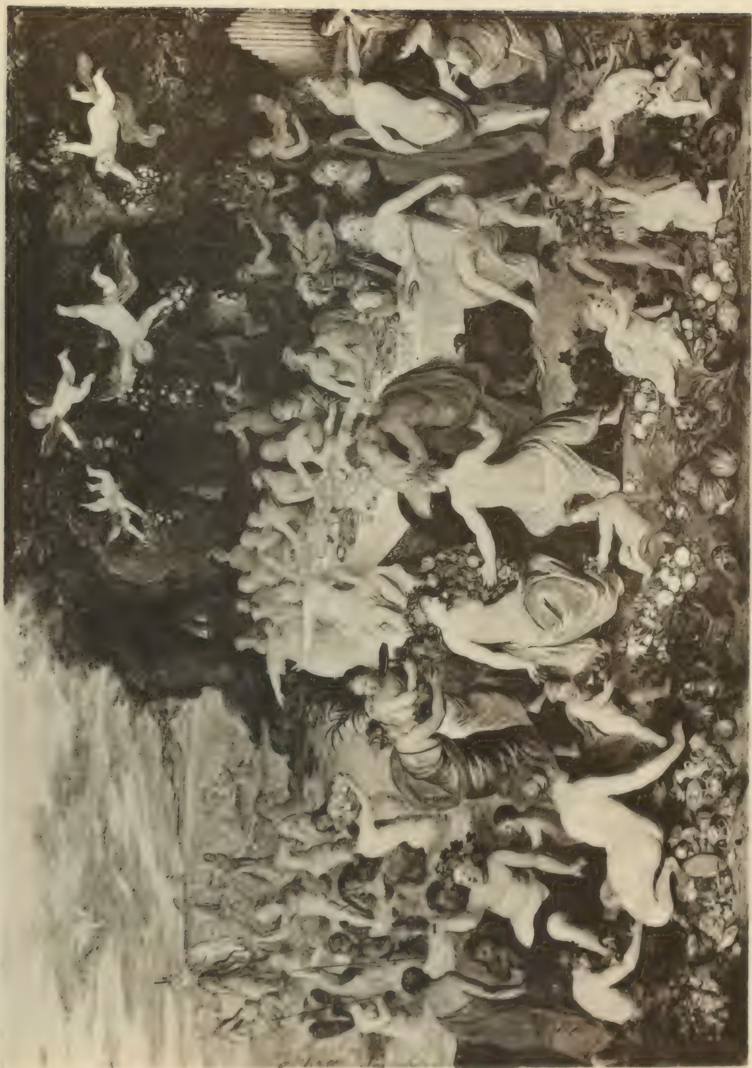
Nr. 48. JAN BRUEGHEL und HENDR. van BALEN.