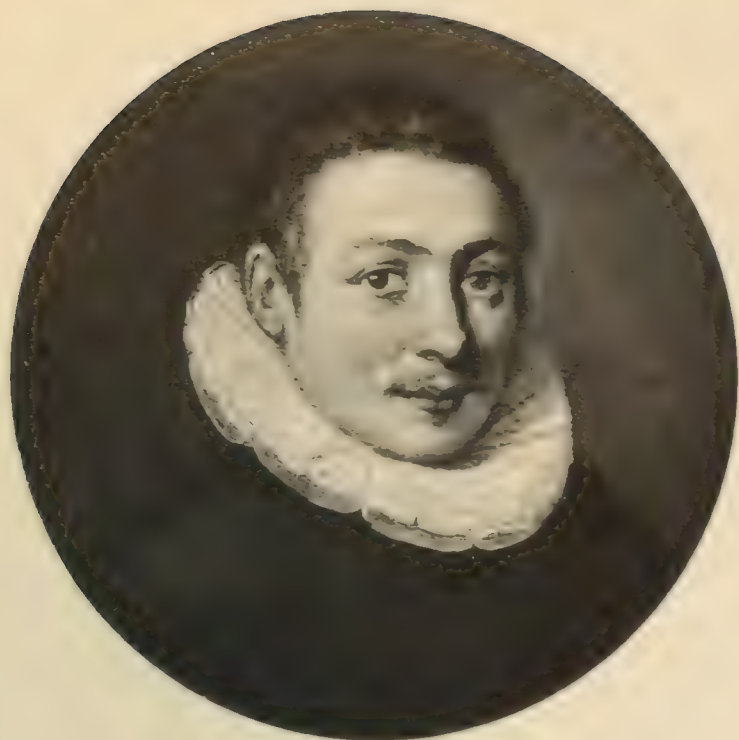
Nr. 95. THOMAS de KEYSER.