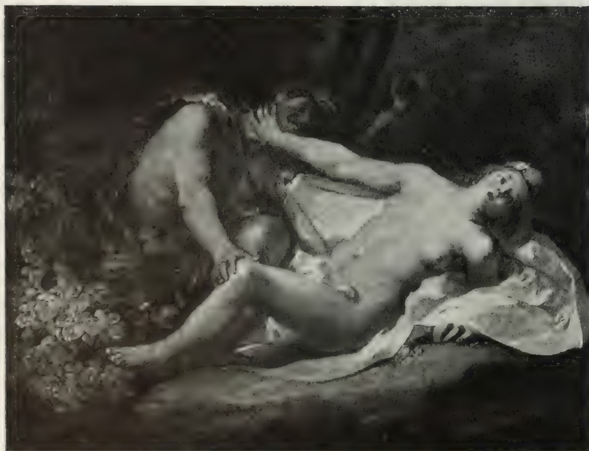
Nr. 78. NICOLAES KNUPFER.