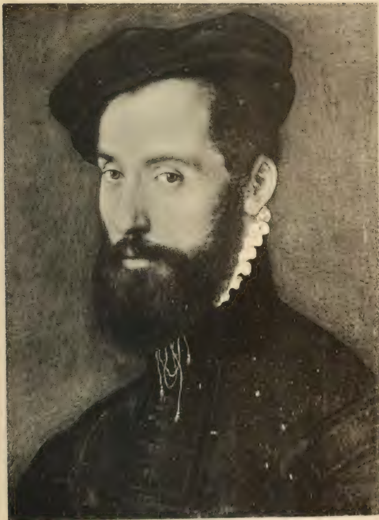
Nr 89. ANTON MOR (van DASHORST).