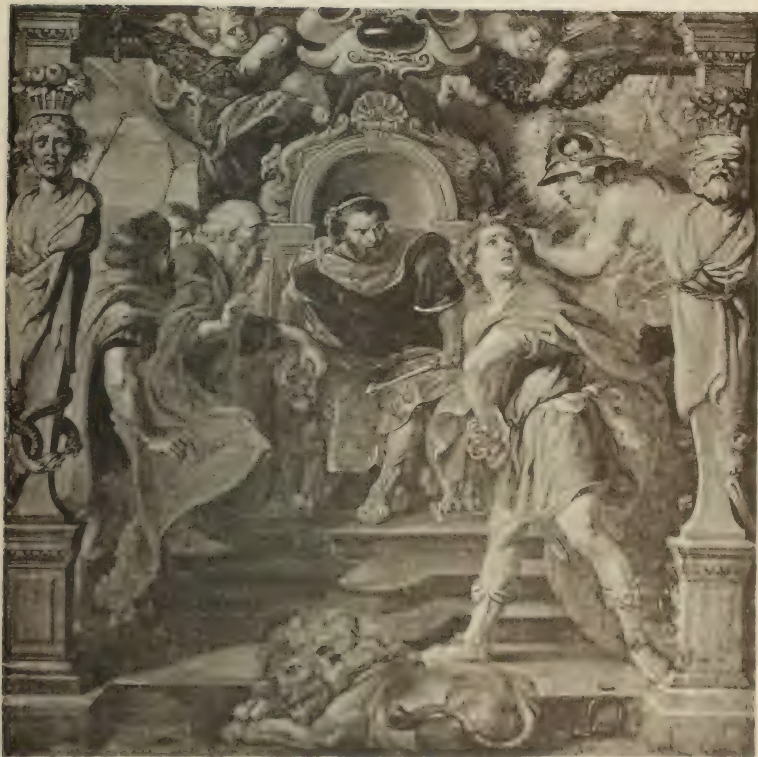
No. 66. PETER PAUL RUBENS