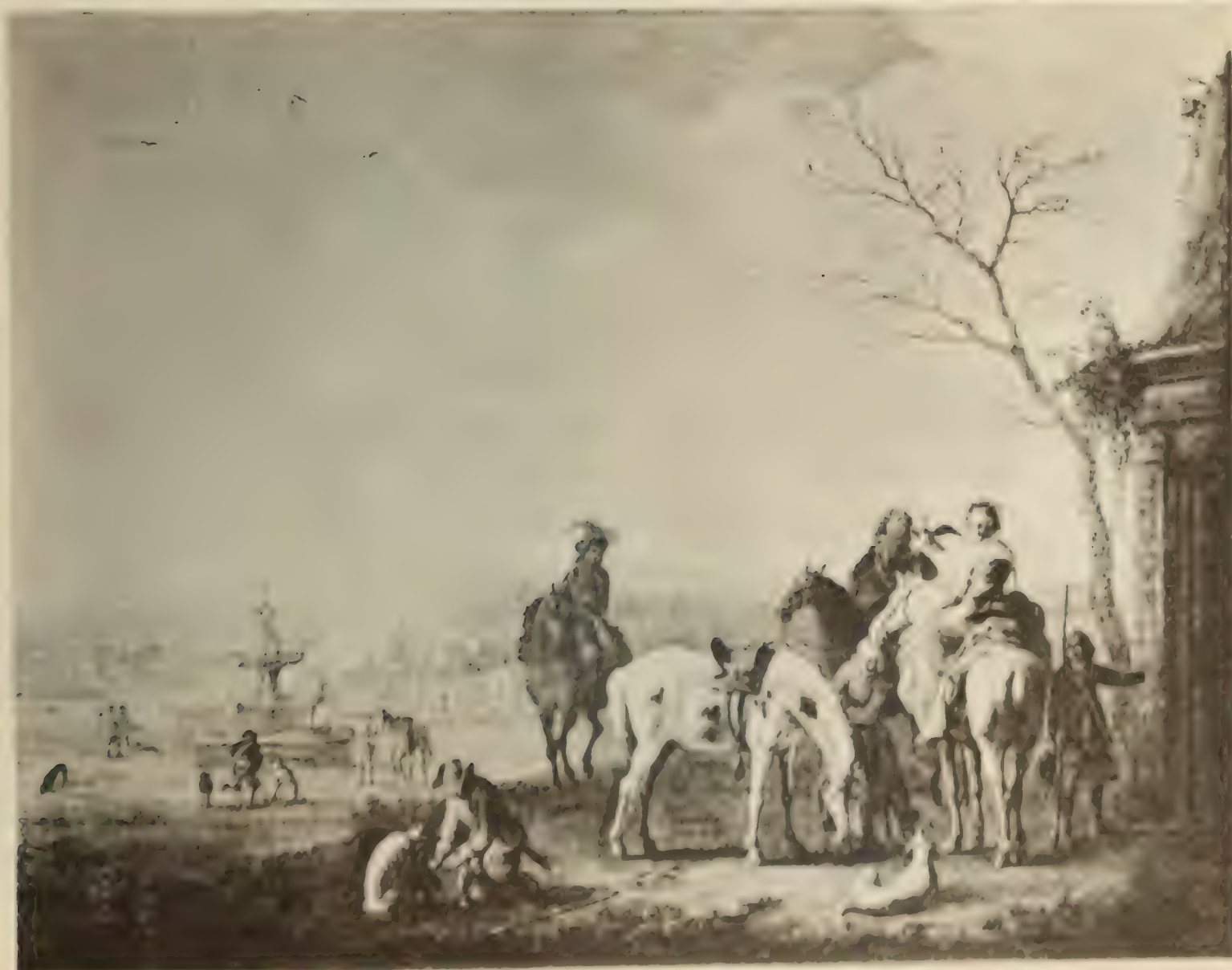
Nr. 63. PHILIP WOUWERMAN.