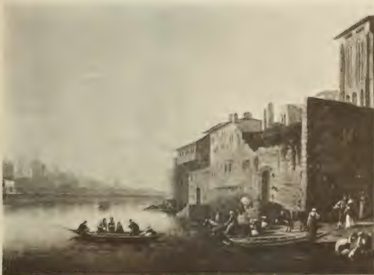
Nr. 59. JAN ASSELIJN, gen. CRABBE.