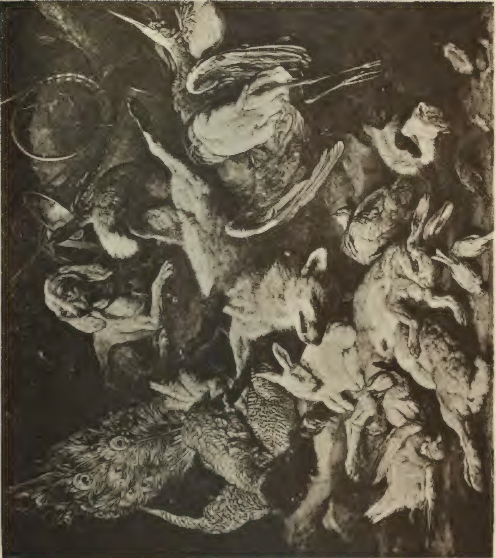
Nr. 60. JAN FIJT.