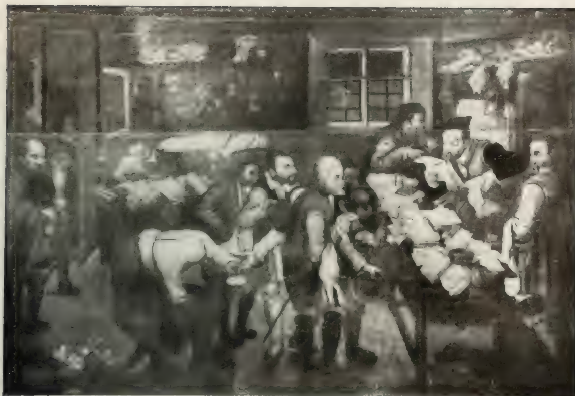
Nr. 117 PIETER BRUEGHEL d. Aelt. Art.