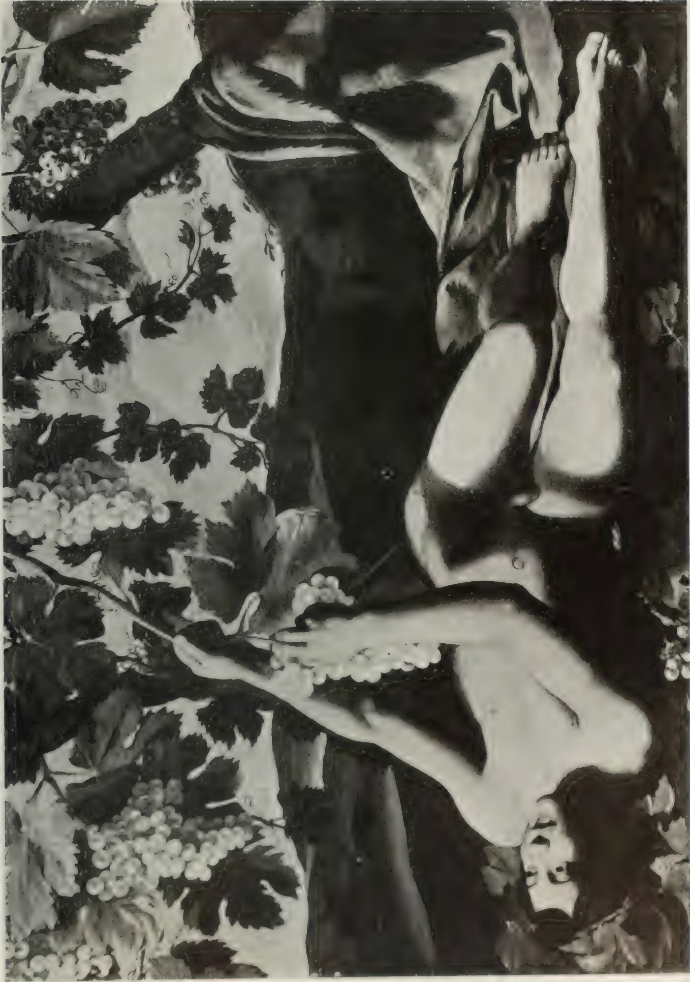
NO. 71. MICHELANGELO da CARAVAGGIO.