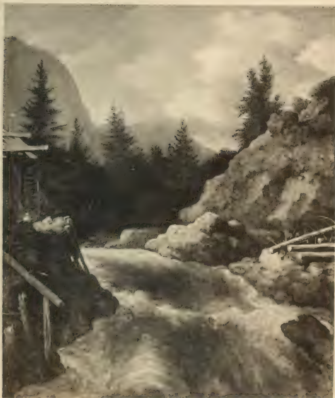
Nr. 87. ALLART van EVERDINGEN.