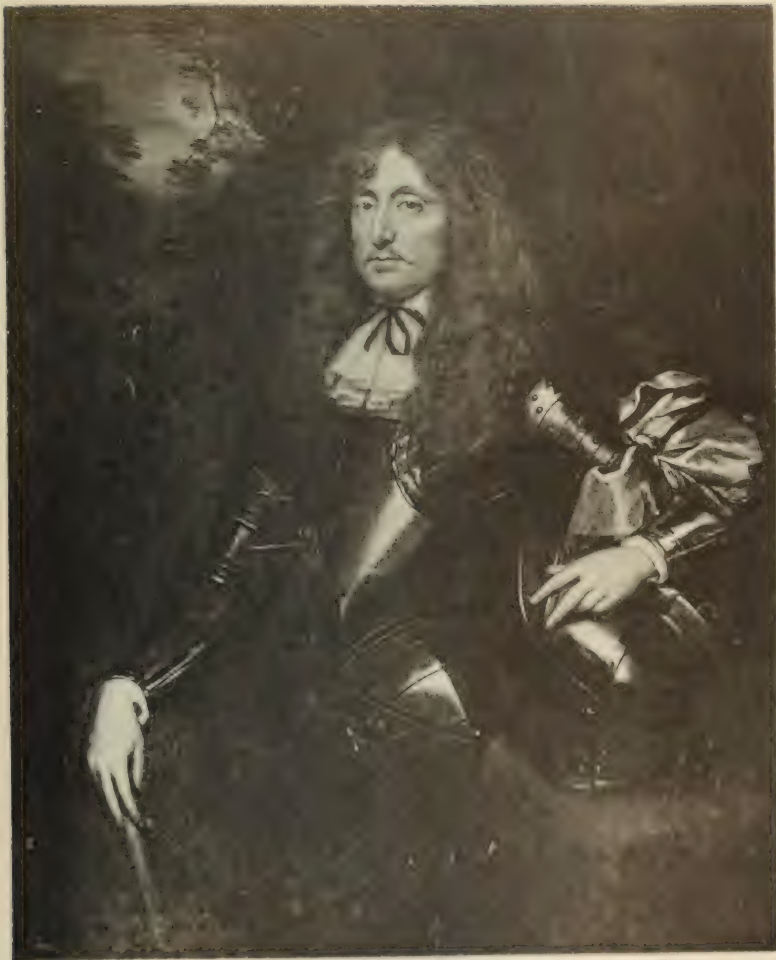
Nr. 53 PIETER van der FAES, gen. 1614.