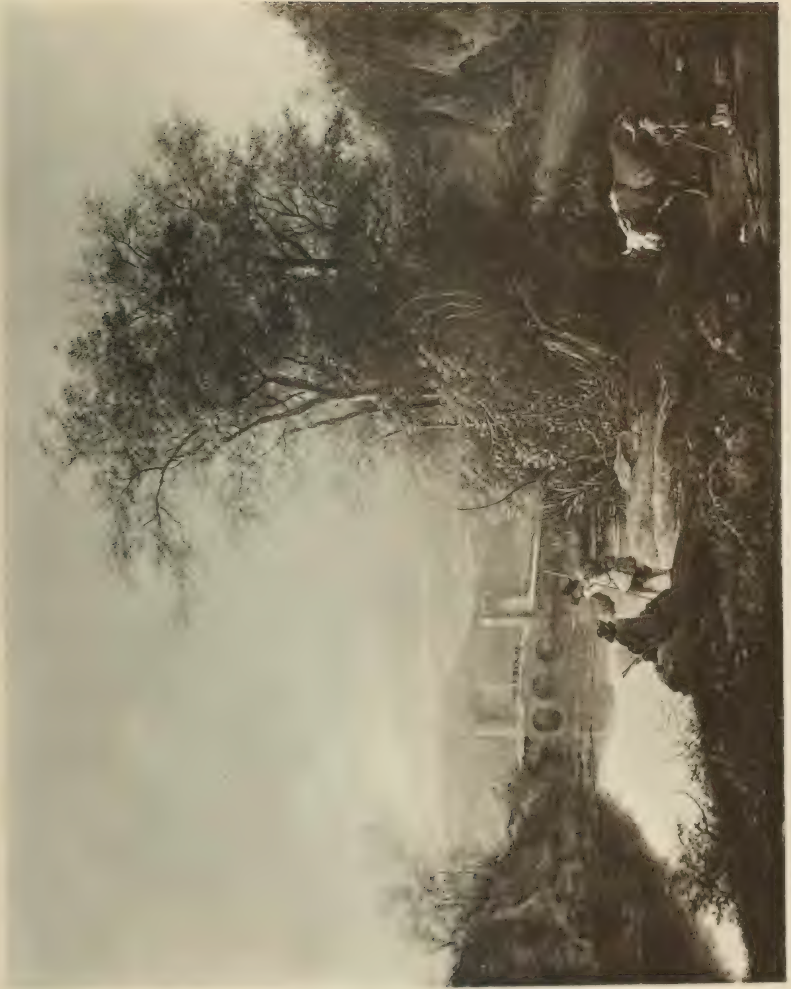
Nr. 58. JAN BOTH.