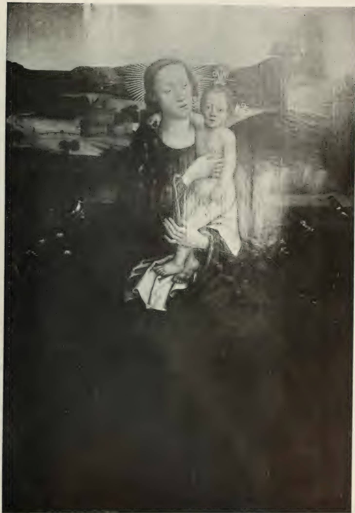
Nr. 99. MARTIN SCHONGAUER. Zugschiff.