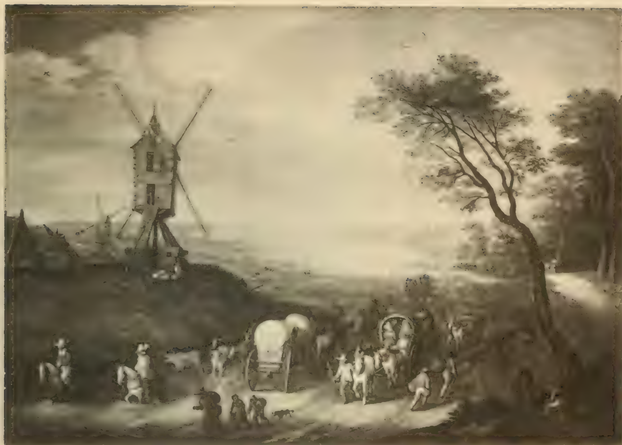
Nr. 90. JAN BRUEGHEL.