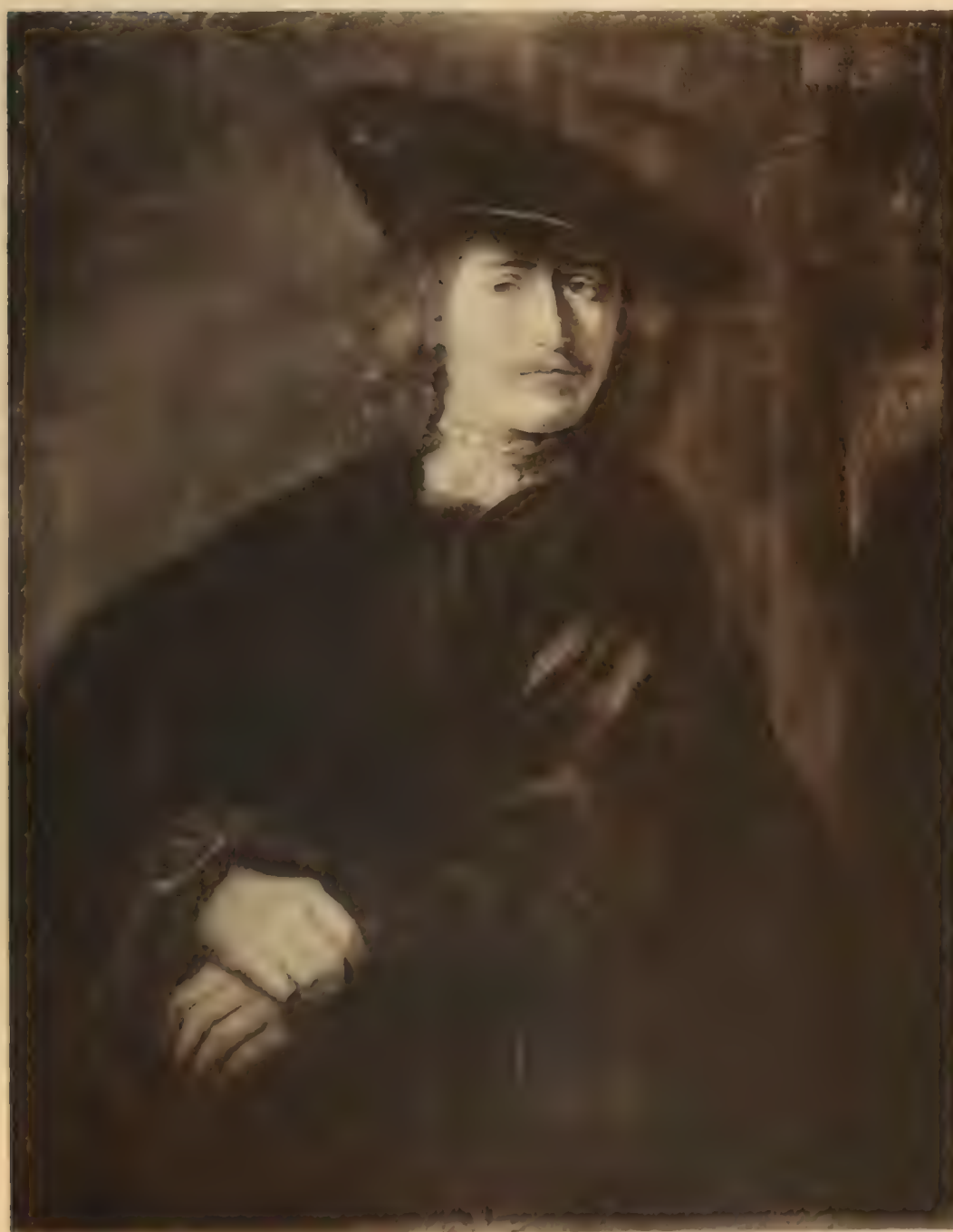
Nr. 85. FERDINAND BOL.