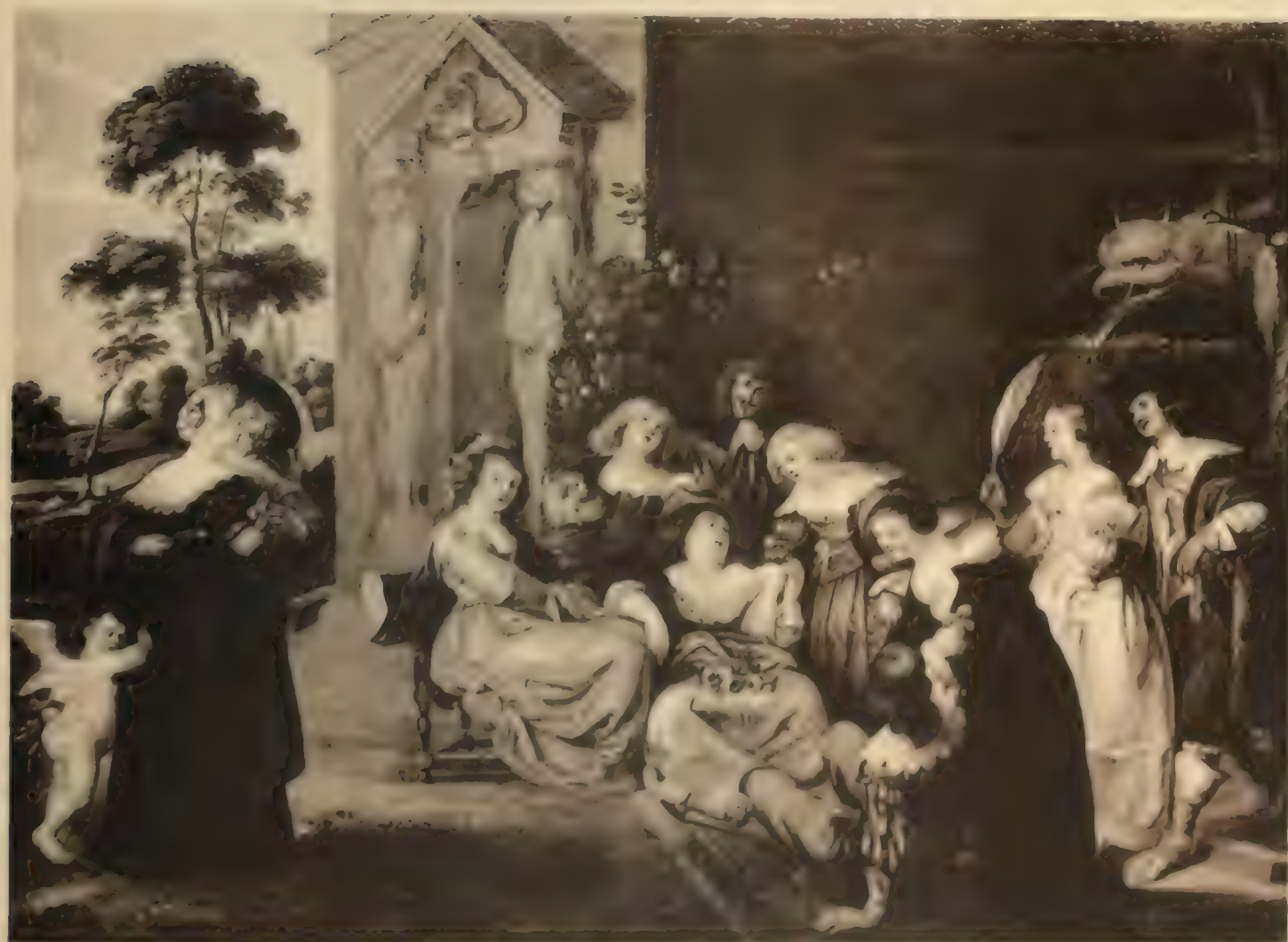
Nr. 86. HENDRIK van BALEN.