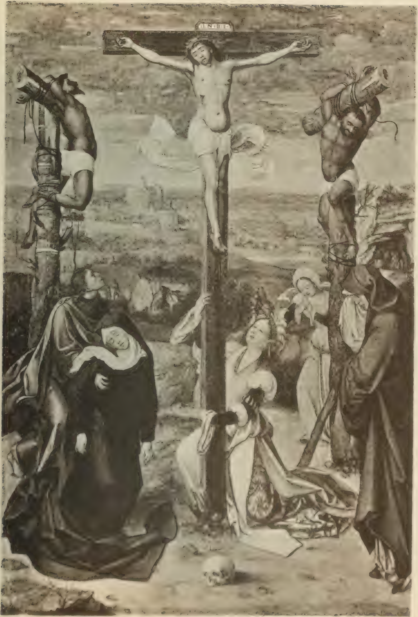
№ 66. ANTWEPENER MEISTER.