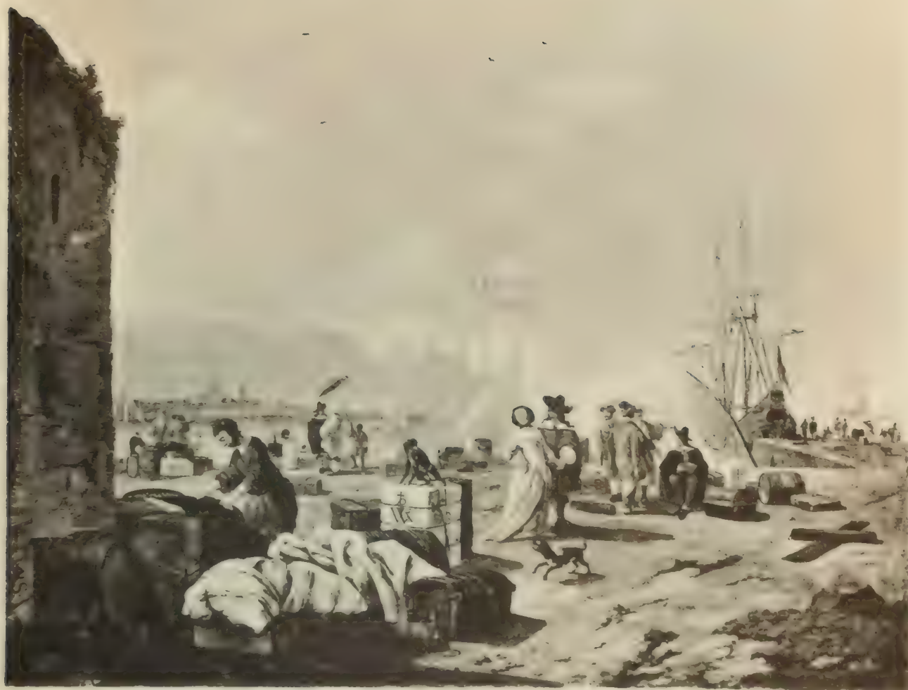
Nr. 40. ABR. CORN. BEGEIJN.