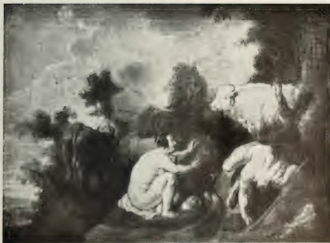
St. 116 JACOB JORDAENS.