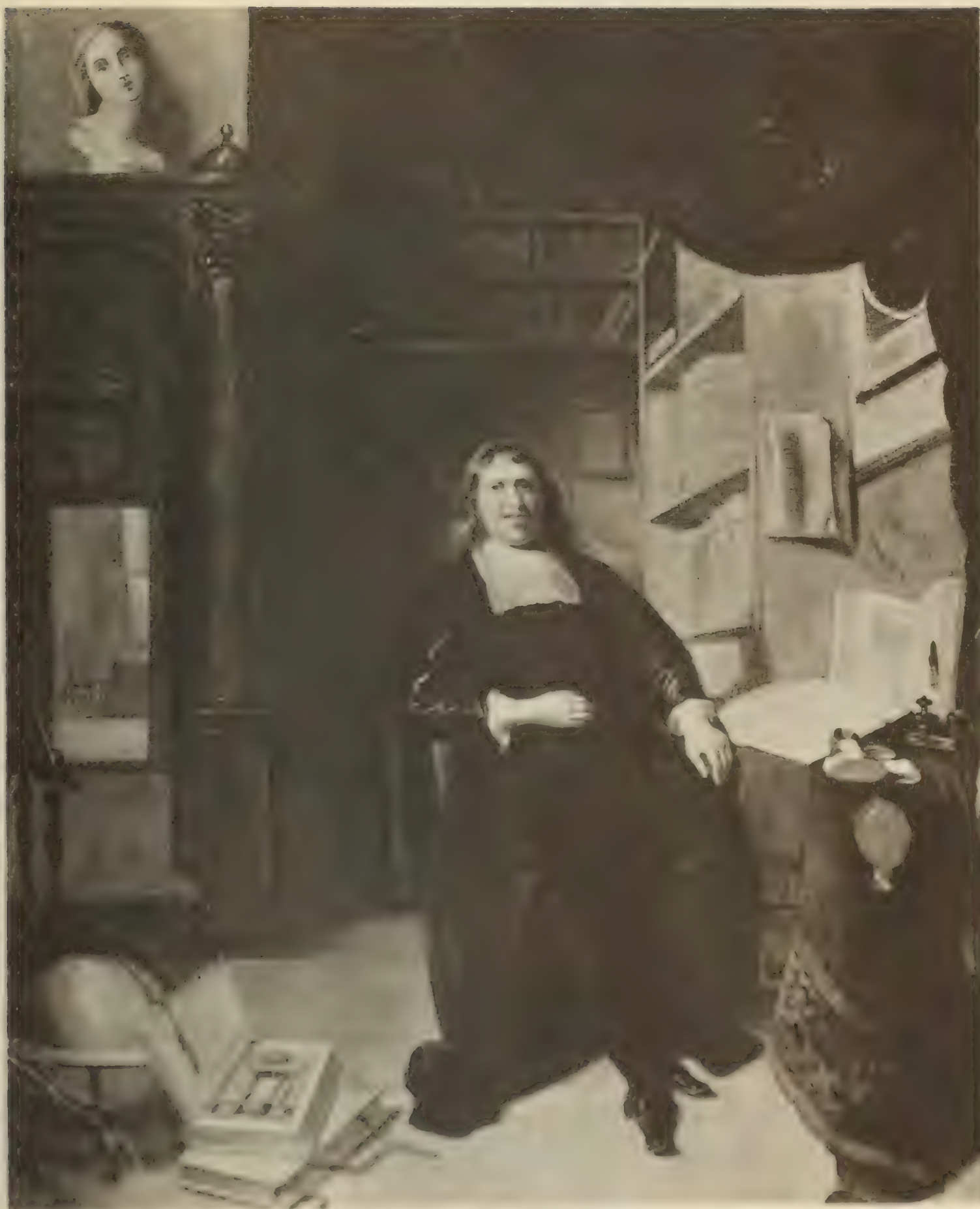
Nr. 62. NICOLAAS MAES