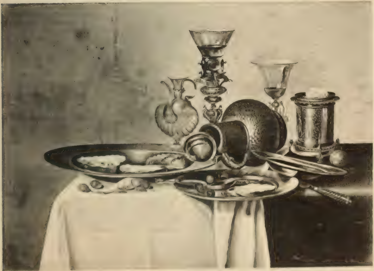
Nr. 91. WILLEM CLAESZ HEDA.