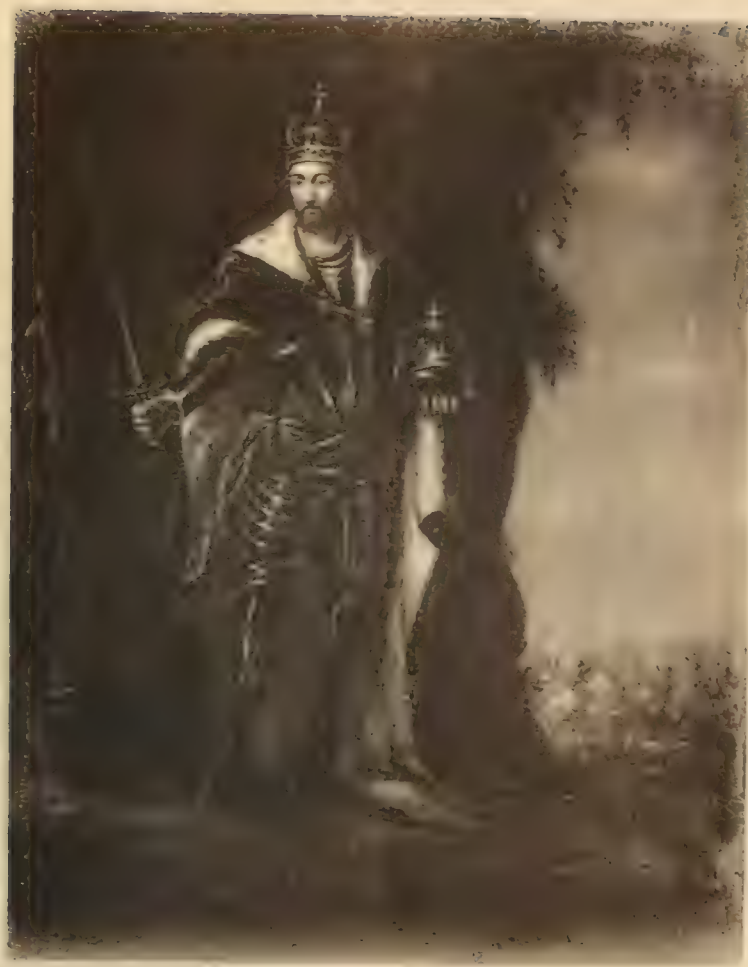
Nr. 119. AUGSBURGER MALER.