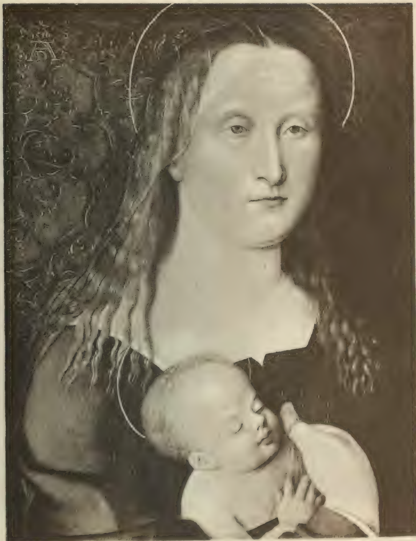
Nr. 57. ALBRECHT DÜRER. Weib mit Kind