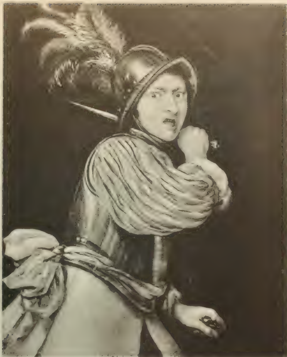
Nr. 44. FRANS van MIERIS.