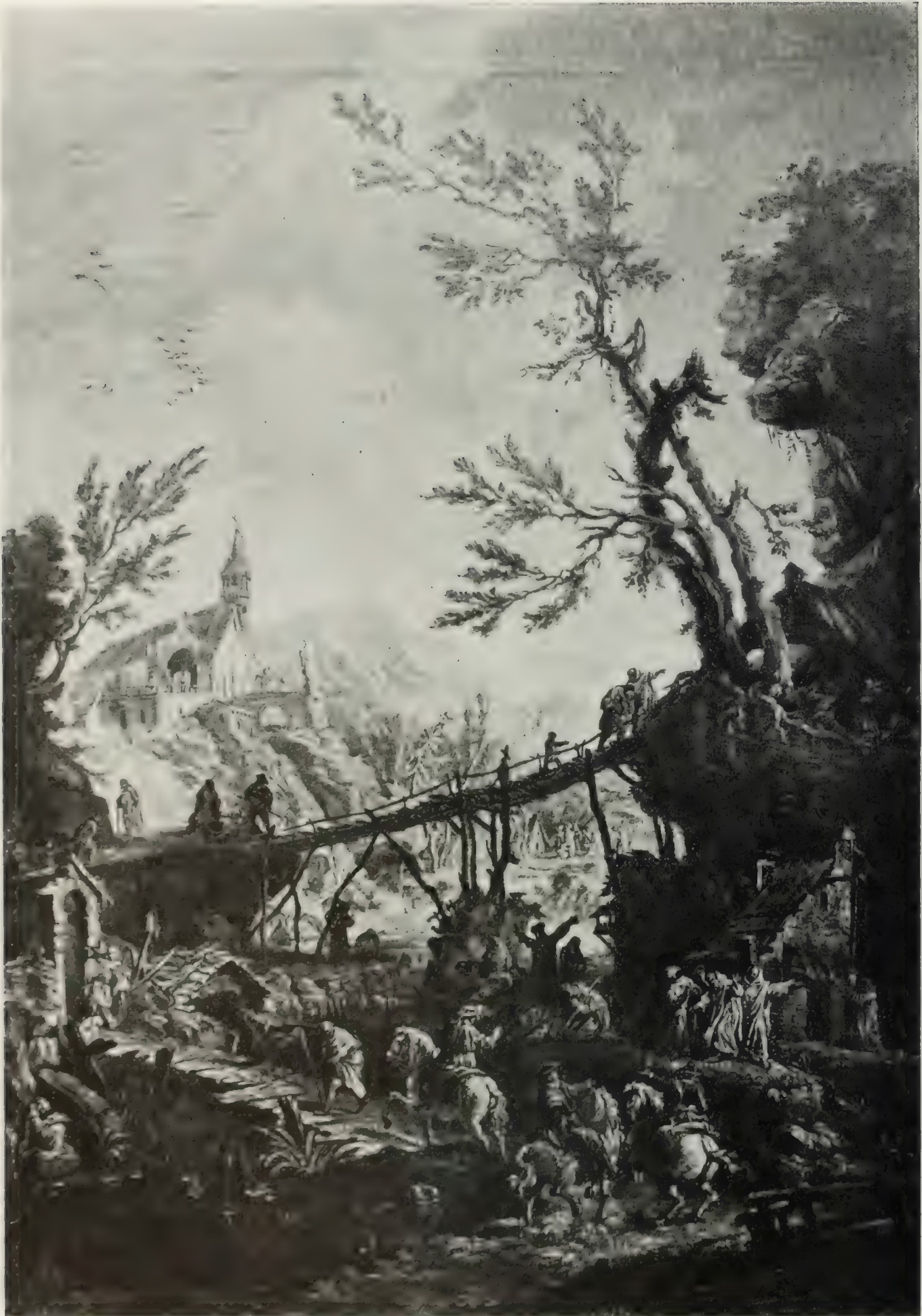
Nr. 77. ALESSANDRO MAGNASCO.