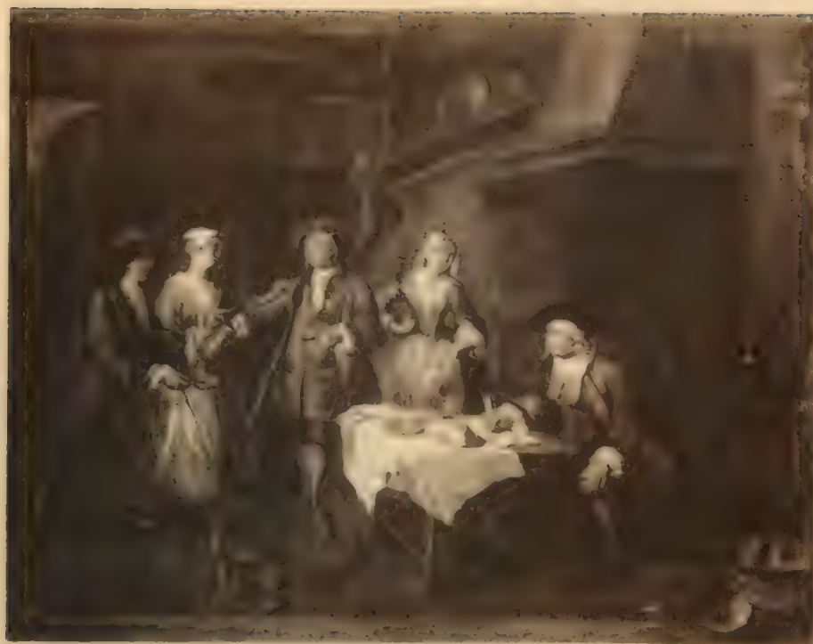
Nr. 120. THEODOR ROOS.