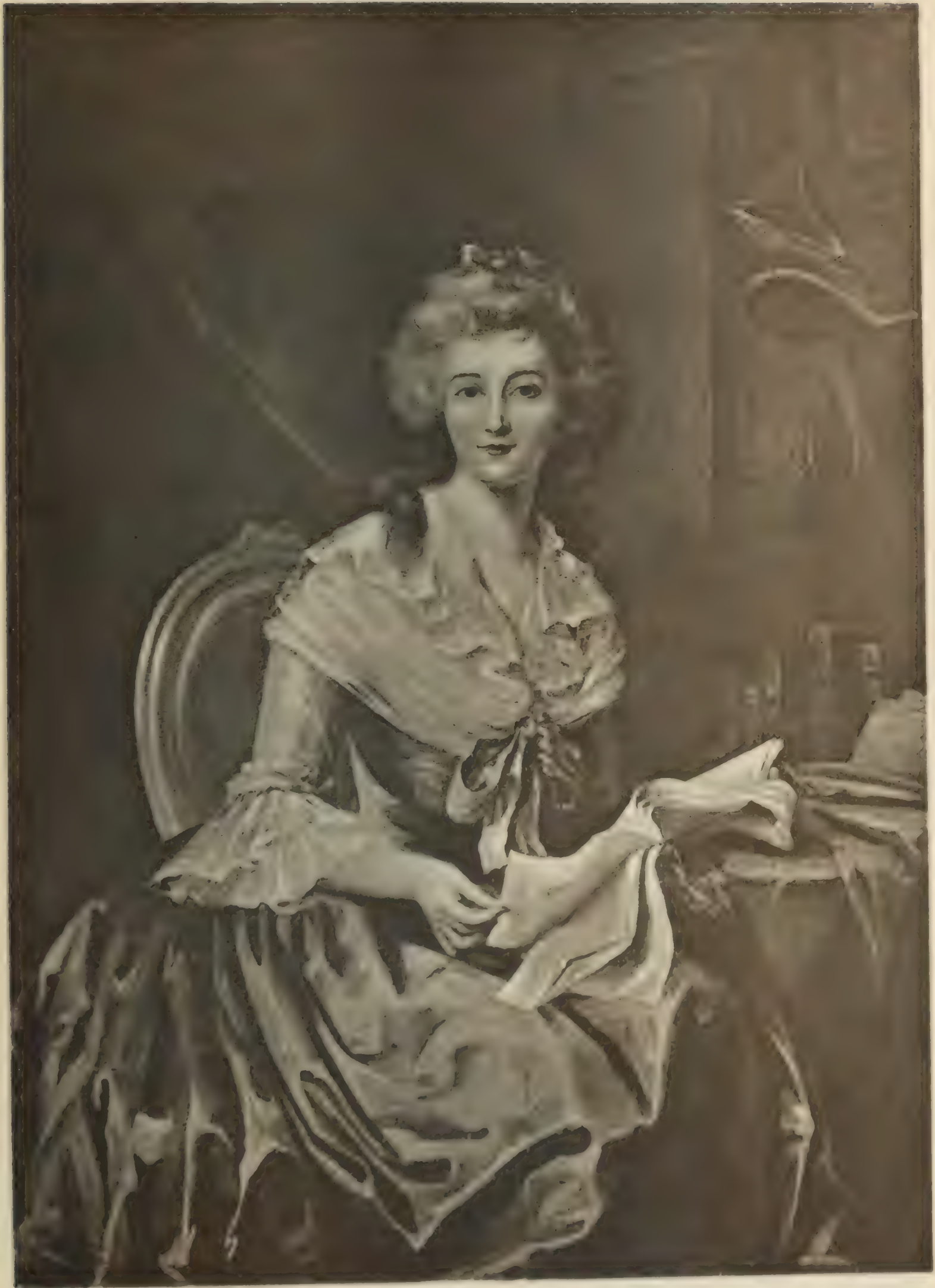
№ 65 EL. LUISE le BRUN, geb. VIGEE.