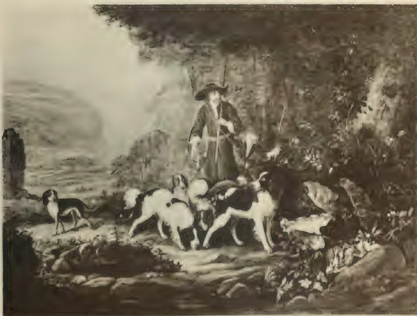
Nr. 16. ARDR. CORN. BEELDEMAKER