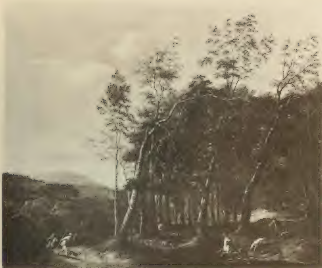
Nr. 49. FREDERIC de MOUCHERON.