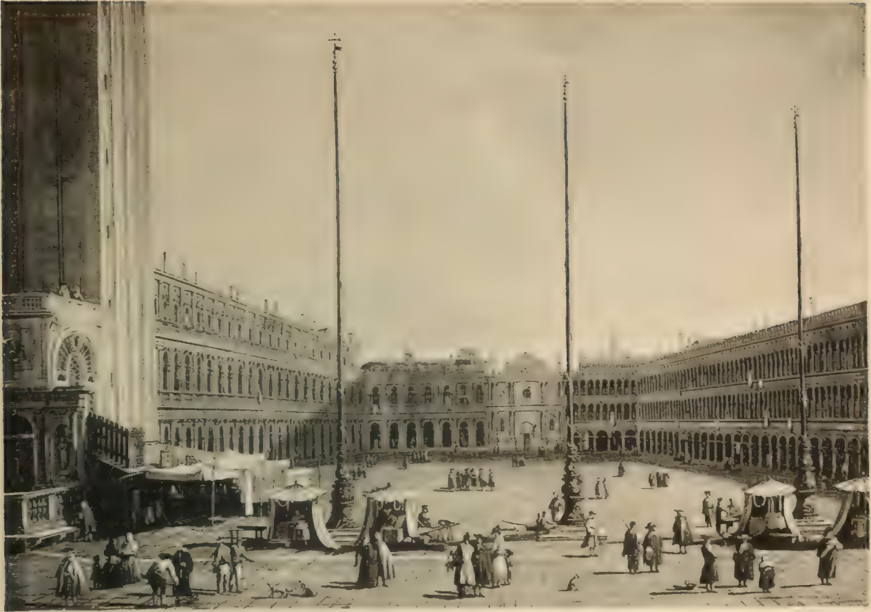
Nr. 108. ANTONIO CANALE.