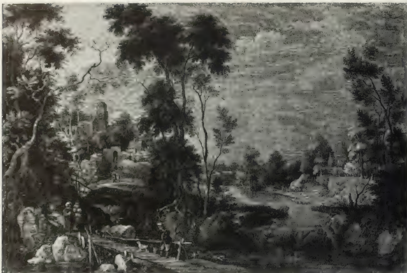
Nr. 81. GILLIS d'HONDECOETER.