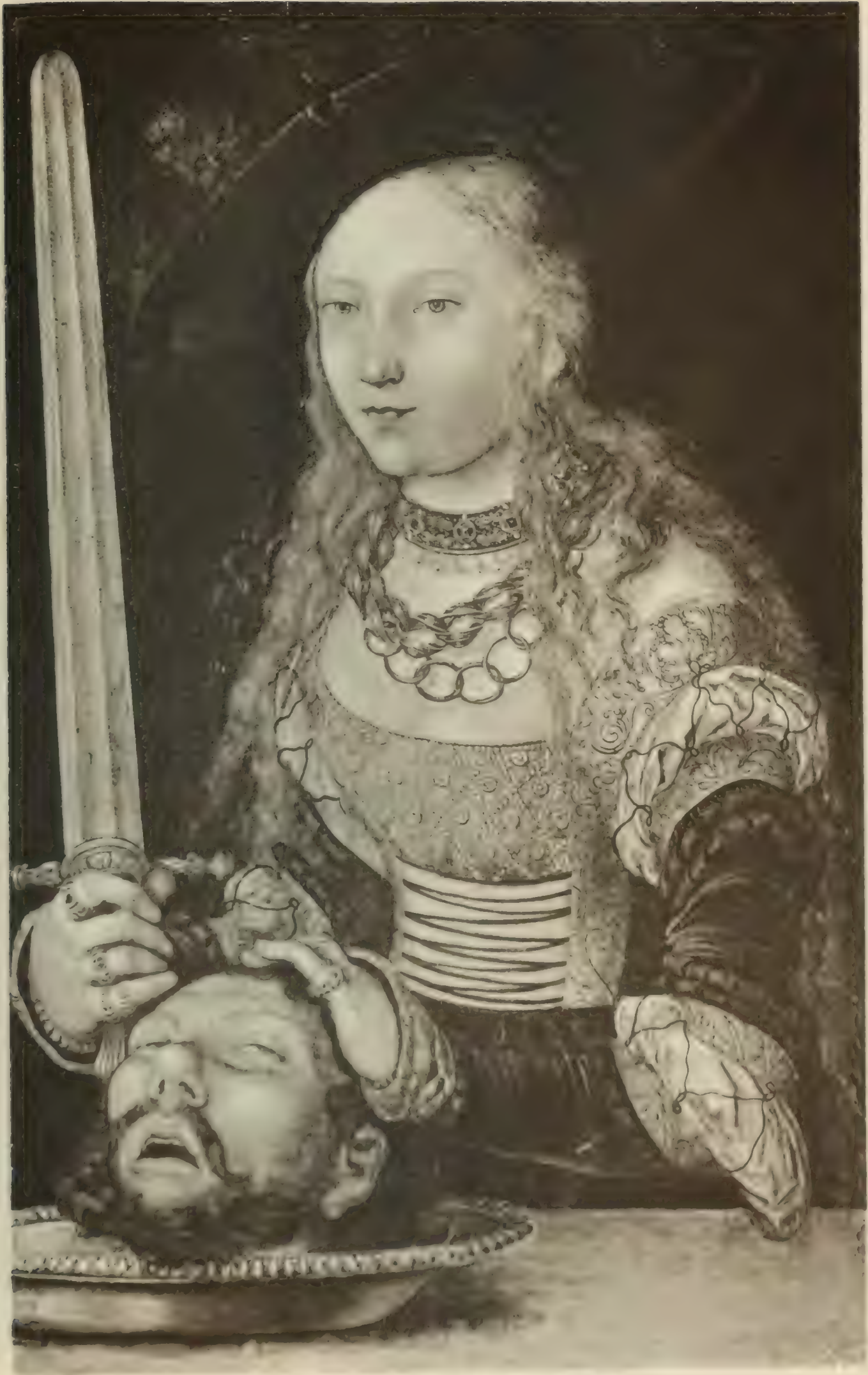
Nr. 64. LUCAS CRANACH d. Ael.