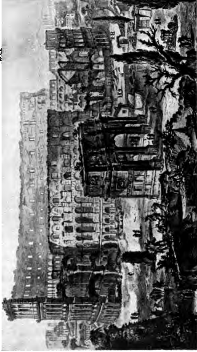
Kolosseum und Konstantinsbogen