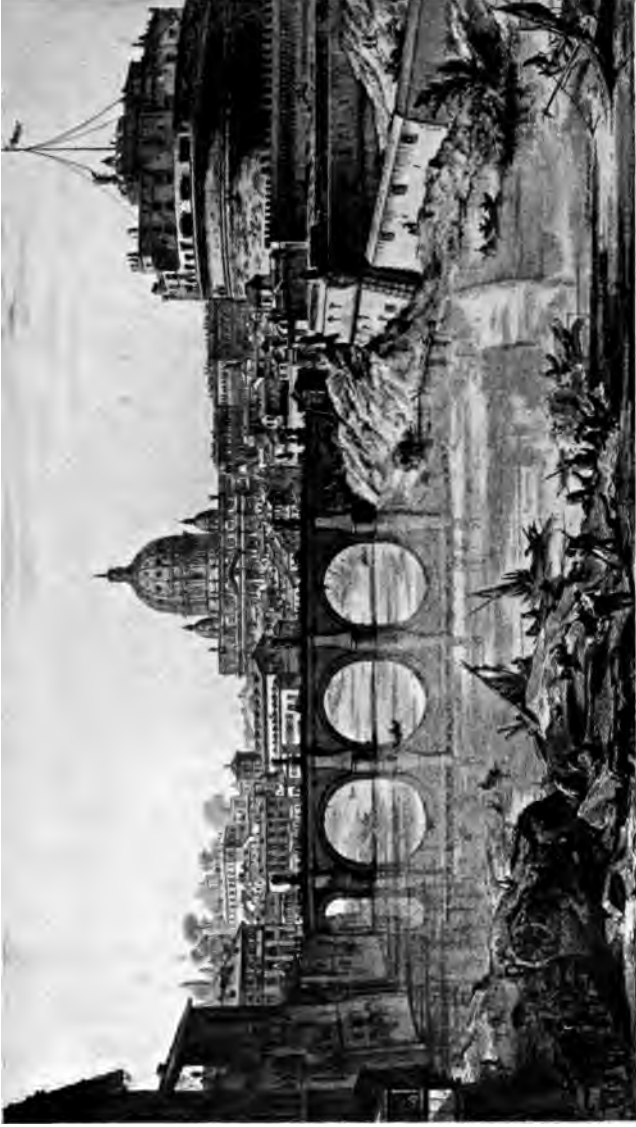
Engelsburg und Engelsbrücke