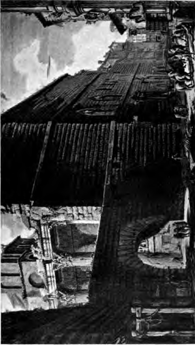
Augustusforum mit Mars-Ullor-Tempel