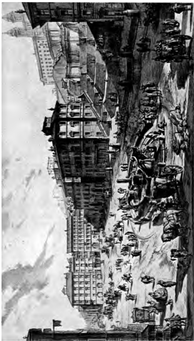
Piazza di Spagna