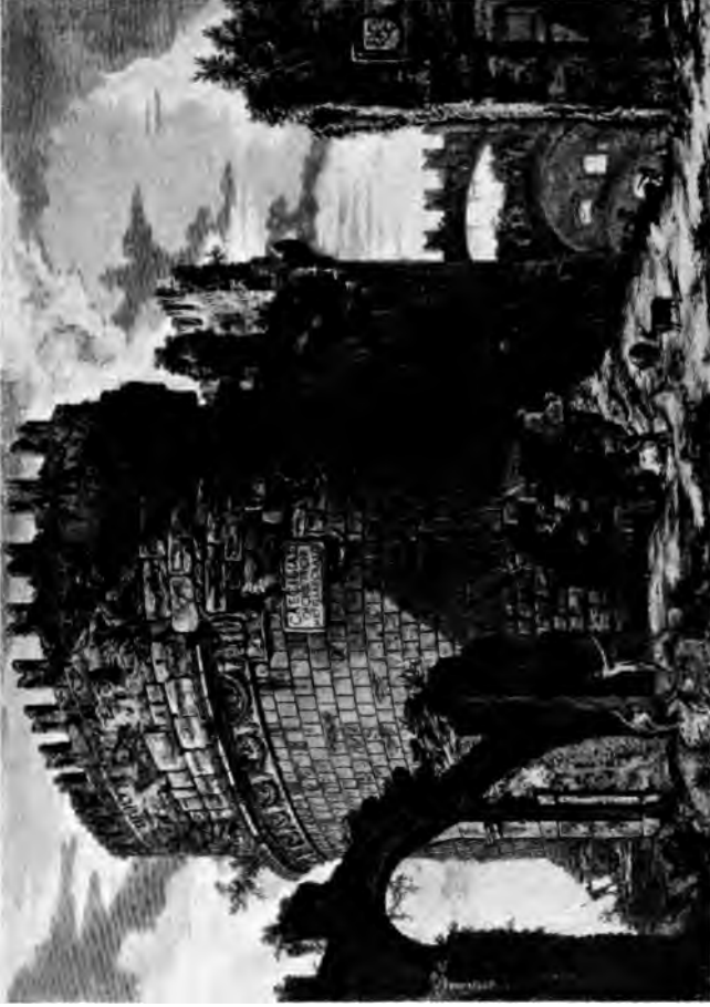
Grabmal der Gaecilia Metella