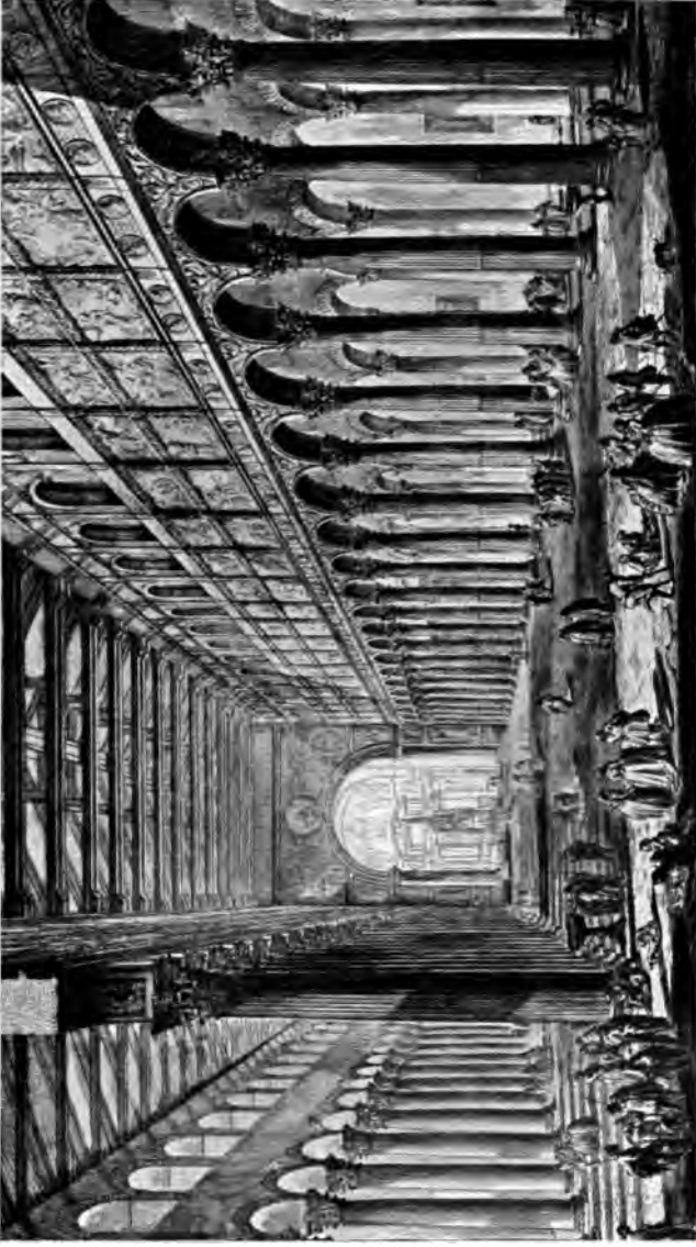
Innereä von San Paolo fuori le Mura