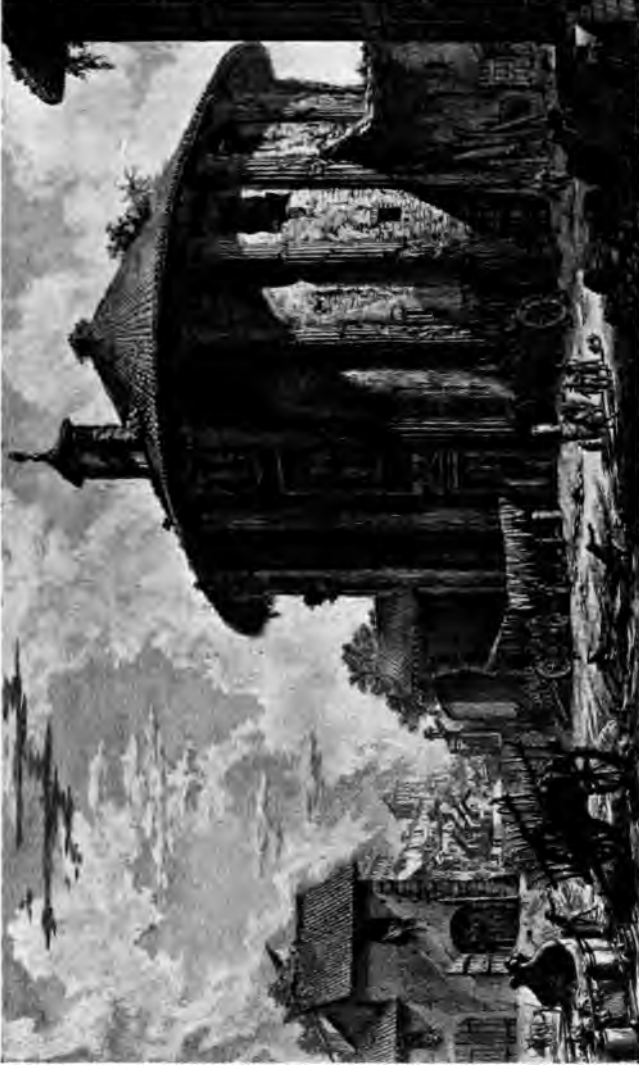
Rundtempel am Tiber