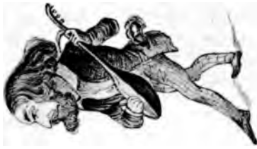
Keine Helden — aber große Klebhaber.