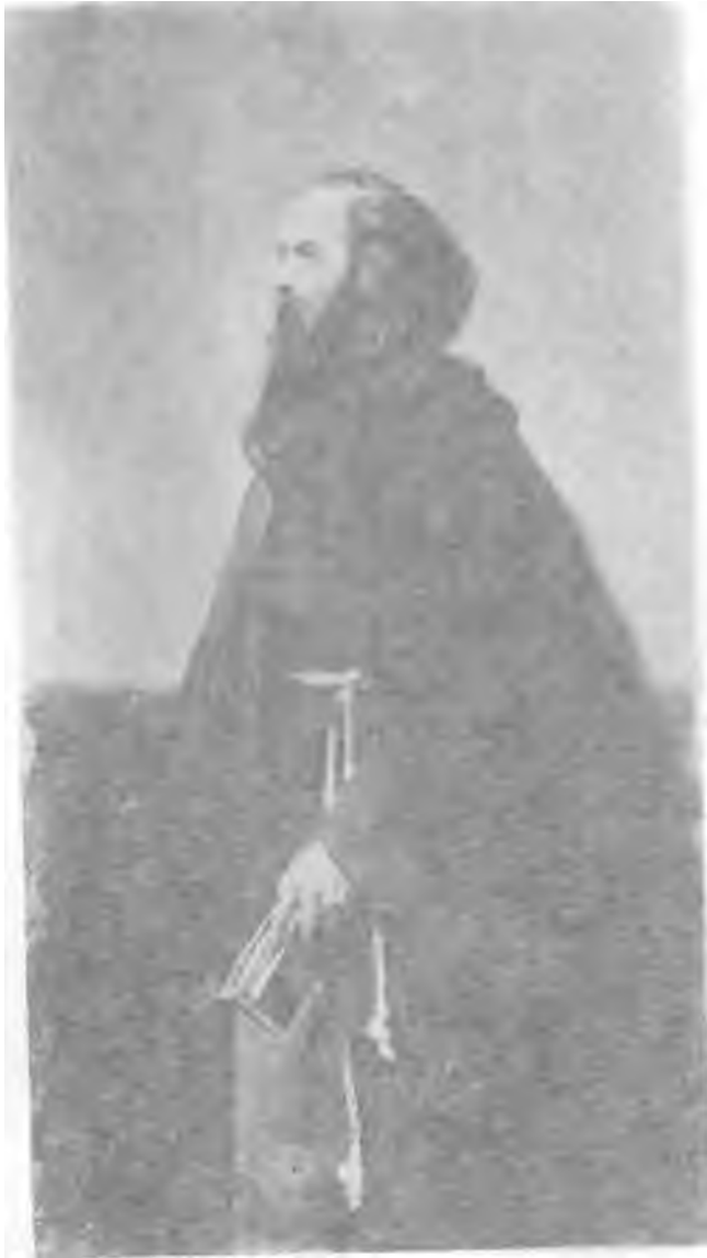
Hermann als Prof. Blau, von Günther von Wolff, Braunschweig, 1871.