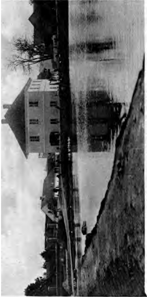
Hartmanns Geburtshaus in Dufschütz an der Kitawka (bei Pribram).