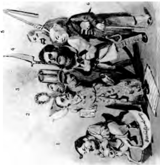
5. Schlössel, Minister der Gerechtigkeit.