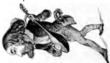
Keine Heiden — aber jeweile Liebhaber.