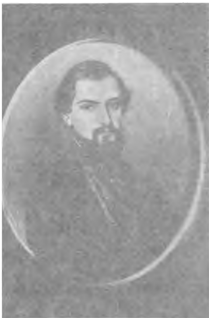
Portrait of the artist, 1840-1845