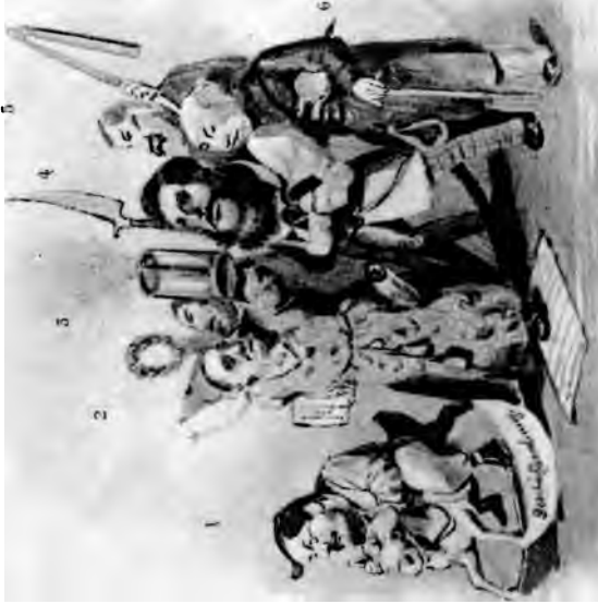
1. Schaffrath, Cerimonienmeister. 2. Buge, Minister des Außern. 3. M. Hartmann, Minister des Innern. 4. Bitt, Kriegsminister. 5. Schlöffel, Minister der Gerechtigkeit. 6. v. Joffe, wickl. geh. Rath.