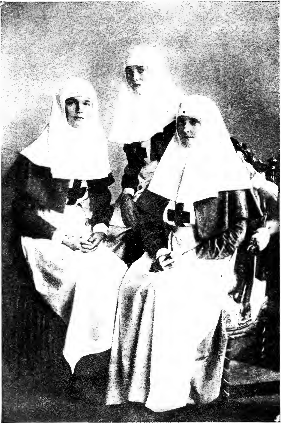
Августѣйшія Сестры милосердія: Императрица Александра Феодоровна, и Великія Княжны Ольга Николаевна и Татьяна Николаевна.