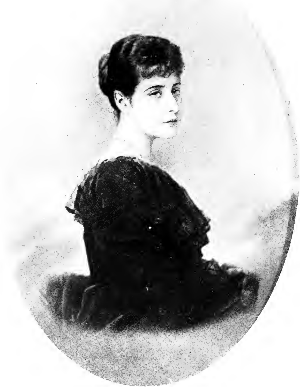
ИМПЕРАТРИЦА АЛЕКСАНДРА ФЕОДОРОВНА (въ первые годы царствованія)