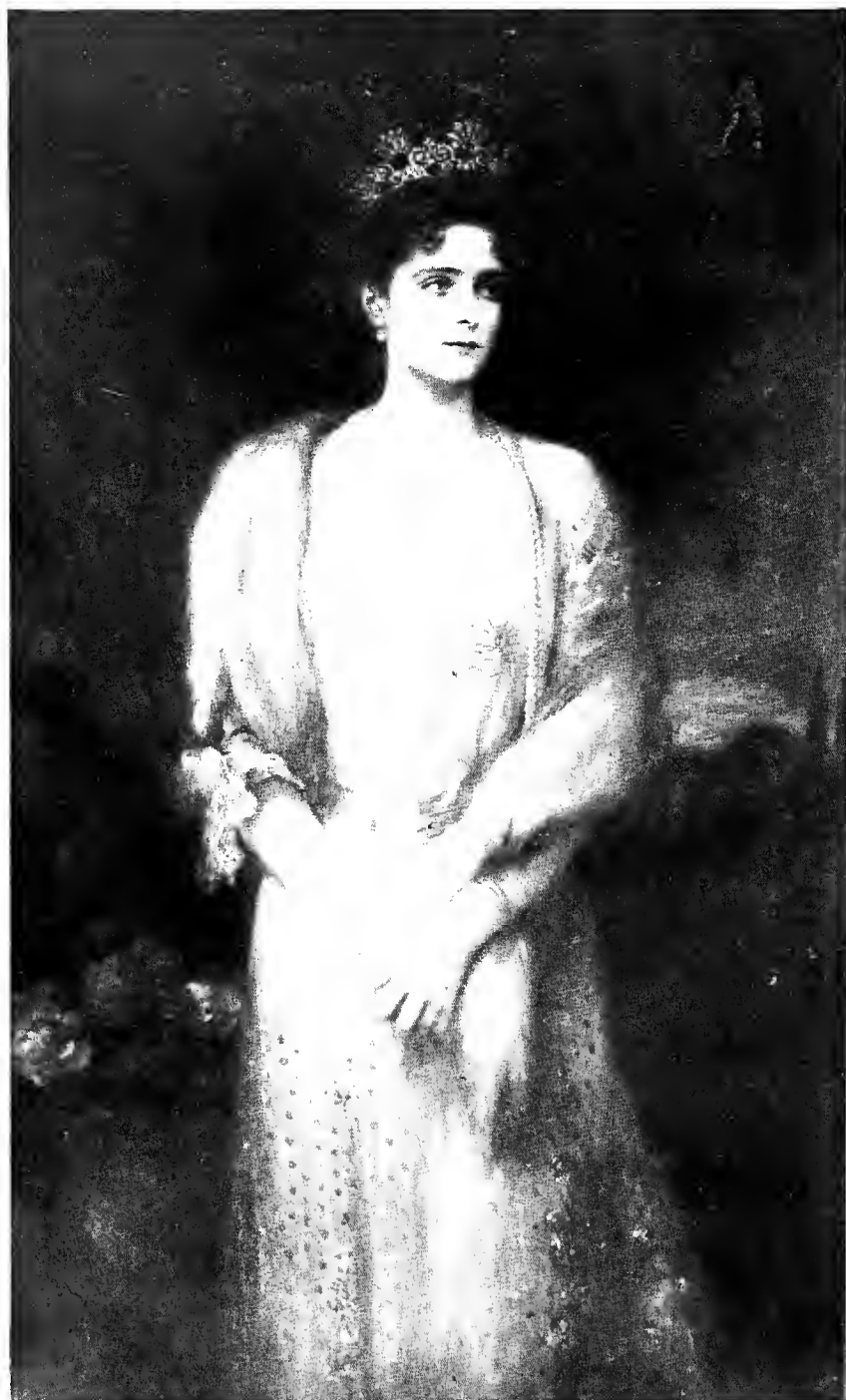
ИМПЕРАТРИЦА АЛЕКСАНДРА ФЕОДОРОВНА (съ портрета Каульбаха)