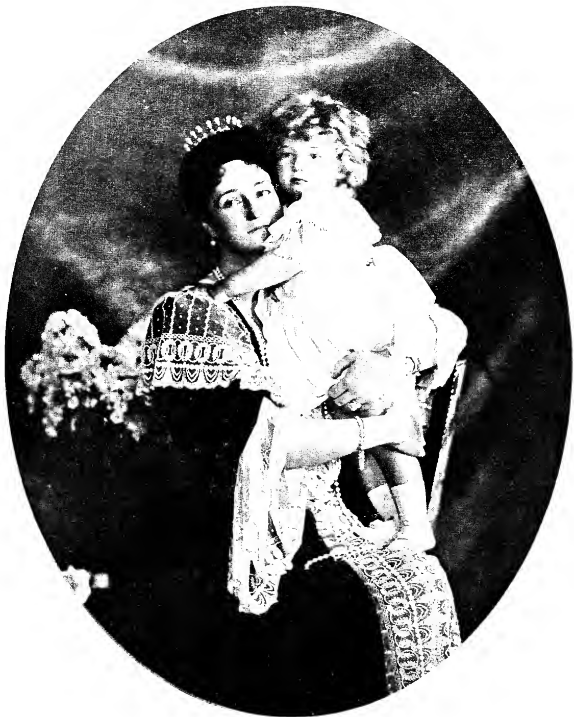
ИМПЕРАТРИЦА АЛЕКСАНДРА ФЕОДОРОВНА съ Наслѣдникомъ Цесаревичемъ Алексѣемъ Николаевичемъ.