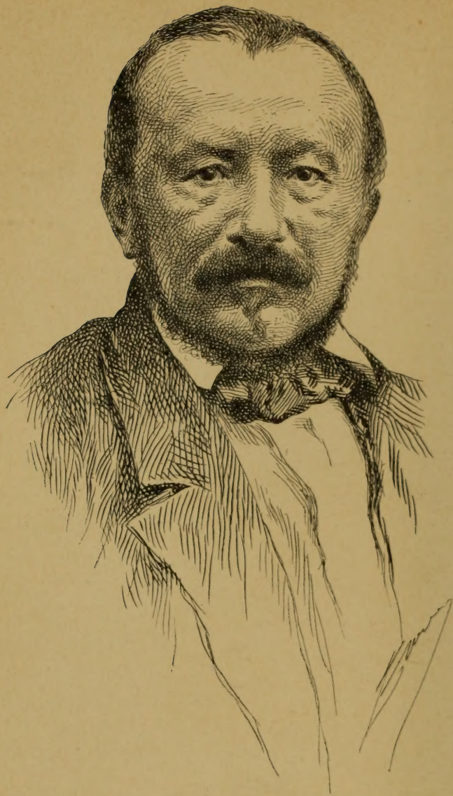
Gérard de Nerval