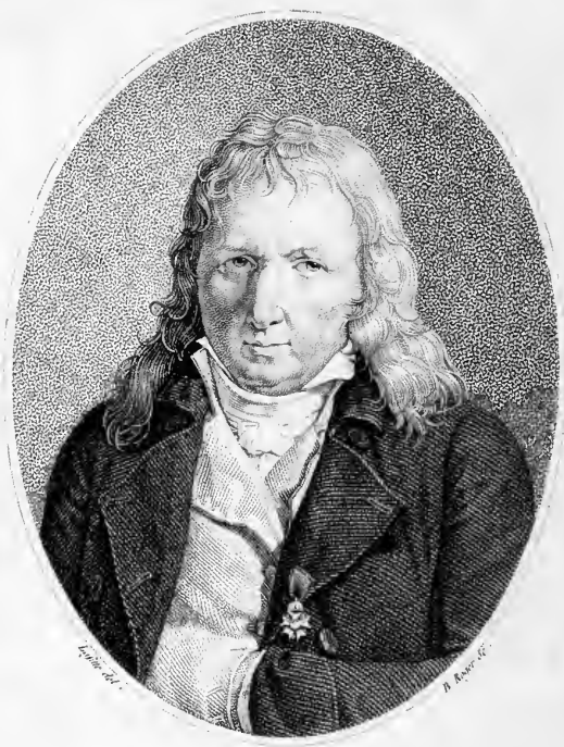
J.H. BERNARDIN DE SAINT PIERRE